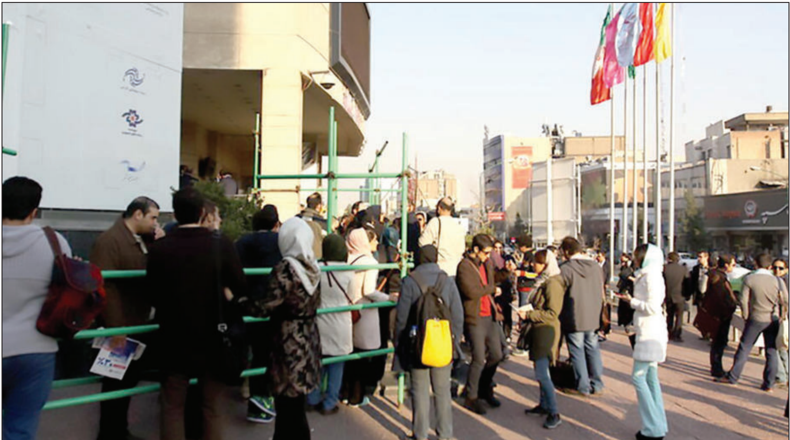
لزوم اجرای اجباری طرح شناور شدن بلیت سینما؛

این فیلم در شاخه‌های بهترین فیلم، کارگردانی، فیلمنامه اصلی، بازیگر مرد و زن، موسیقی متن، طراحی تولید، تدوین و ... نیز در جوایز اسکار حضور خواهد داشت. فیلم حماسی اکشن و سه ساعته «RRR»، روایتگر داستان دو مرد میهن پرست اما از نظر فلسفی مخالف (رام چاران و ان.تی.راما راتو جونپور) را دنبال می‌کند که برای نجات دختری از دست مقامات استعماری بریتانیا در دهلی دهه ۱۹۲۰ متحد می‌شوند. این فیلم که در سراسر جهان با درآمدهای هنگفتی از گیشه همراه شده است، تاکنون ۵۰ کشور نمایندگان خود را برای شرکت در جوایز اسکار ۲۰۲۳ معرفی کرده‌اند و سینمای ایران نیز فیلم «جنگ جهانی سوم» ساخته هومن سیدی را برای حضور در این رقابت برگزیده است.آخرین مهلت معرفی نمایندگان منتخب کشورها برای رقابت در شاخه بهترین فیلم بین‌المللی اسکار ۲۰۲۳، تا سوم اکتبر ۲۰۲۲ (۱۱ مهر ماه ۱۴۰۱) است. فهرست نامزدهای اولیه شاخه شامل ۱۵ فیلم در تاریخ ۲۰۲۳ دسامبر ۲۰۲۲ (۳۰ آذر) و ۵ نامزدهای نهایی نیز روز ۲۴ ژانویه ۲۰۲۳ (۴ بهمن) معرفی می‌شوند.مراسم نود و پنجمین دوره جوایز سینمایی اسکار روز ۱۲ مارس ۲۰۲۳ (اسفند در تئاتر دالیی در هالیوود برگزار می‌شود.