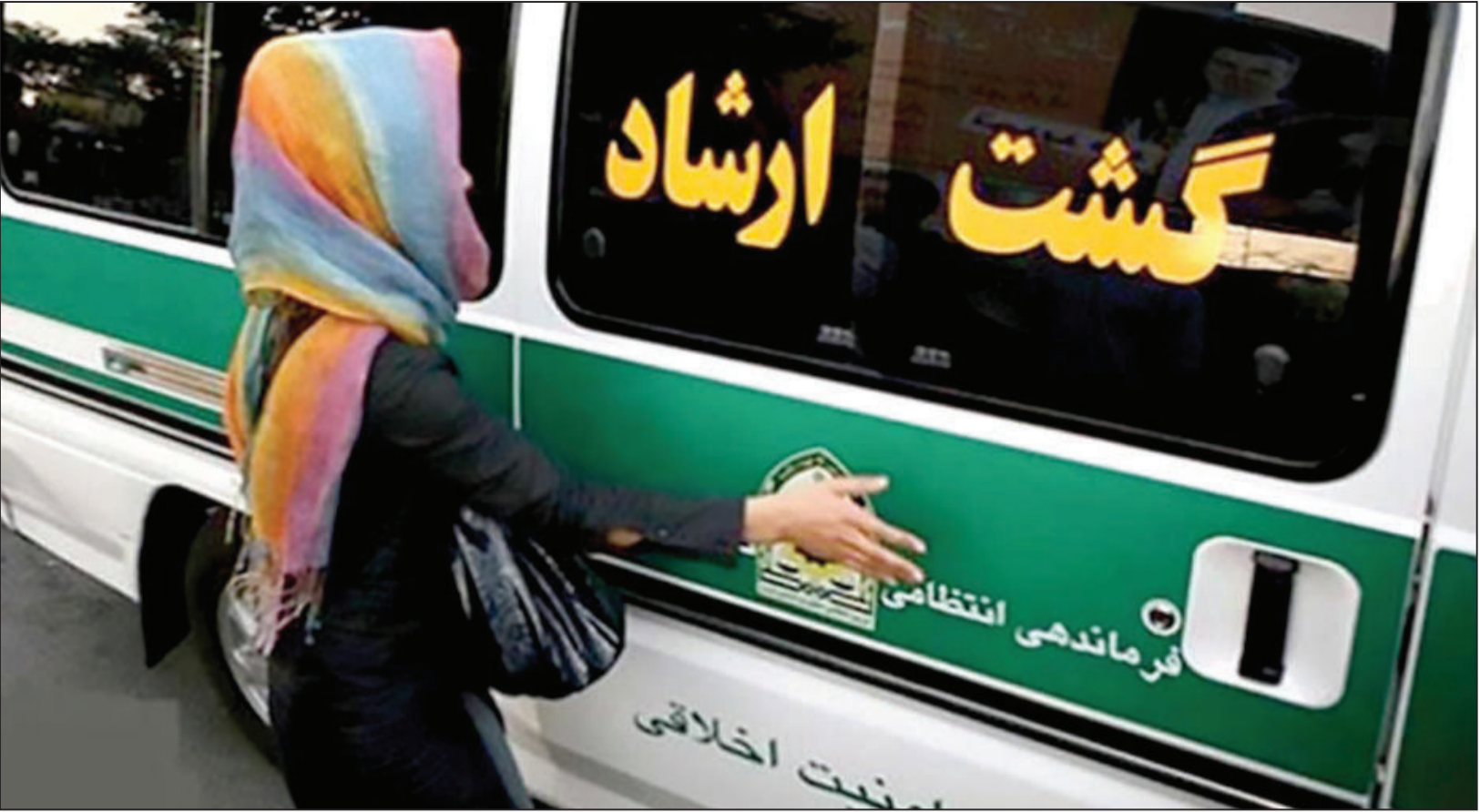
ستاد امر به معروف با فعالیت گشت ار شاد، به شکل کنونی مخالف است

الان کشور به سمت آن رفته است و مکانیزم آن را چیده است.می شود از این ظرفیت استفاده کرد ضمن اینکه گشت ارشاد هزینه دارد، اگردر این