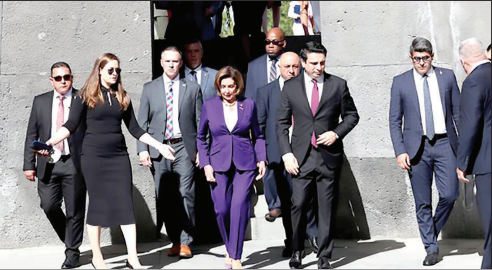
سفر نانسى پلوسى به ارمنستان؛

اسلامی گفت: تا ۲۰ سال قبل تاکنون شاهد طرح روایت‌های مختلف از سوی صهیونیست‌ها و غربی‌ها علیه برنامه هسته‌ای هستیم و طرح اتهاماتی علیه صنعت هسته‌ای ما همچنان ادامه دارد. رئیس سازمان انرژی اتمی ایران بیان کرد: از ۲۰ سال پیش جریان‌های علیه صنعت هسته‌ای کشورمان توسط منافقان و به رهبری صهیونیست‌ها در مسیر سازمان‌های بین‌المللی مانند شورای امنیت و آژانس بین‌المللی انرژی اتمی آغاز شد که در نهایت منجر به اعمال تحریم‌های سنگین علیه ایران شد. وی گفت: ۲۰ سال مذاکرات توسط مسئولان مختلف انجام شد و در نهایت به توافق برجام رسید که یک توافق با دو ستون است: در یک ستون ما برای شفافیت و اعتمادسازی سرعت خود را کاهش دادیم و آن‌ها نظارت خود را بیشتر کردند و در ستون دیگر قرار بر رفع اتهامات و تحریم‌ها علیه ایران بود که غرب تعهدات خود را اجرا نکرد و از برجام خارج شد، حالا که قصد برگشت به برجام را دارند، می‌گویند این مسائل جدید و غیر از برجام است! درحالی که این مسائیل از سال ۲۰۰۳ وجود داشته و اکنون و در سال ۲۰۲۲ اتفاق جدیدی رخ نداده است. اسلامی تأکید کرد: اتهامات علیه ایران را اسرائیل