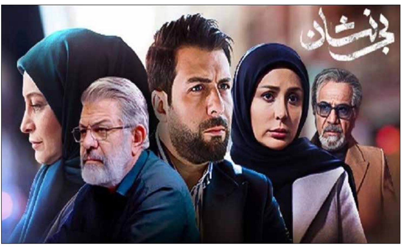
از واقعیت تا تصور در شخصیت‌پردازی