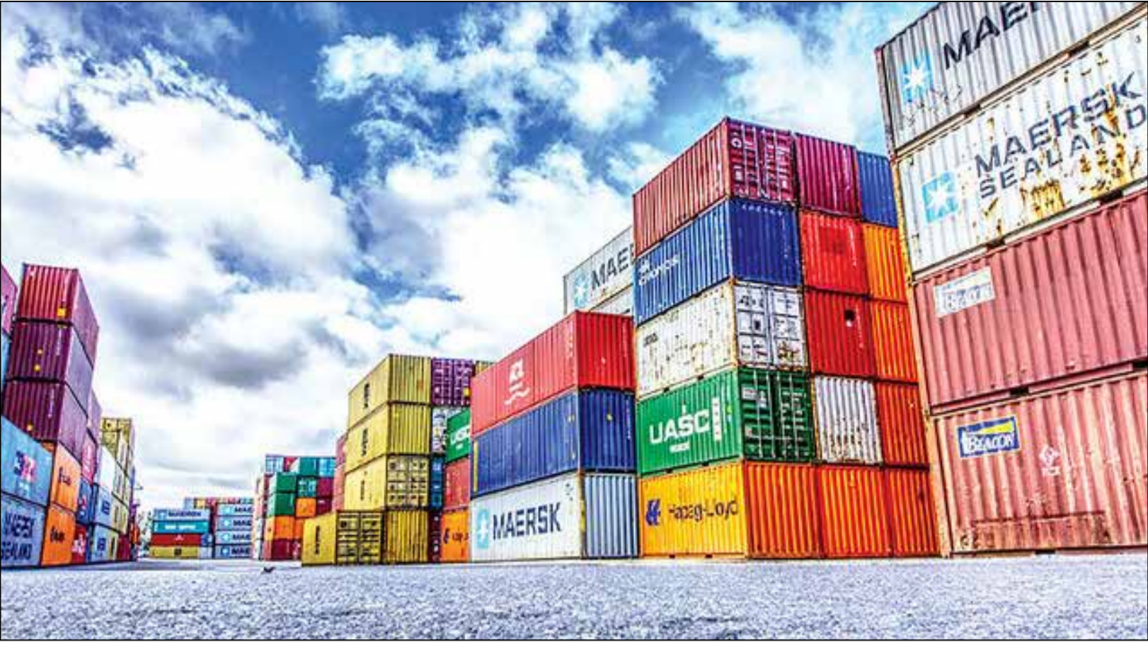
بنگلادش، روسیه، استرالیا، پاکستان، ترکیه، اسپانیا و پرتغال مقاصد رایجی برای هیأت‌های تجاری استان؛