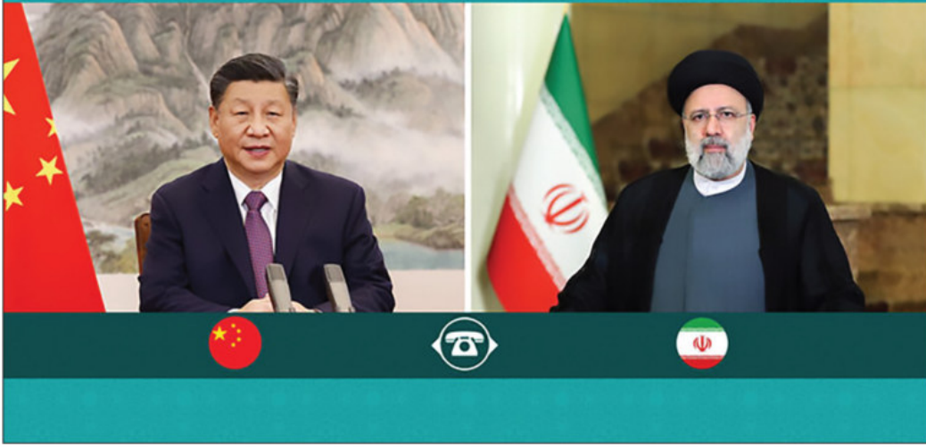
تقاهات تهران - پکن در گفت‌وگوی یک‌ساعته رؤسای جمهور ایران و چین