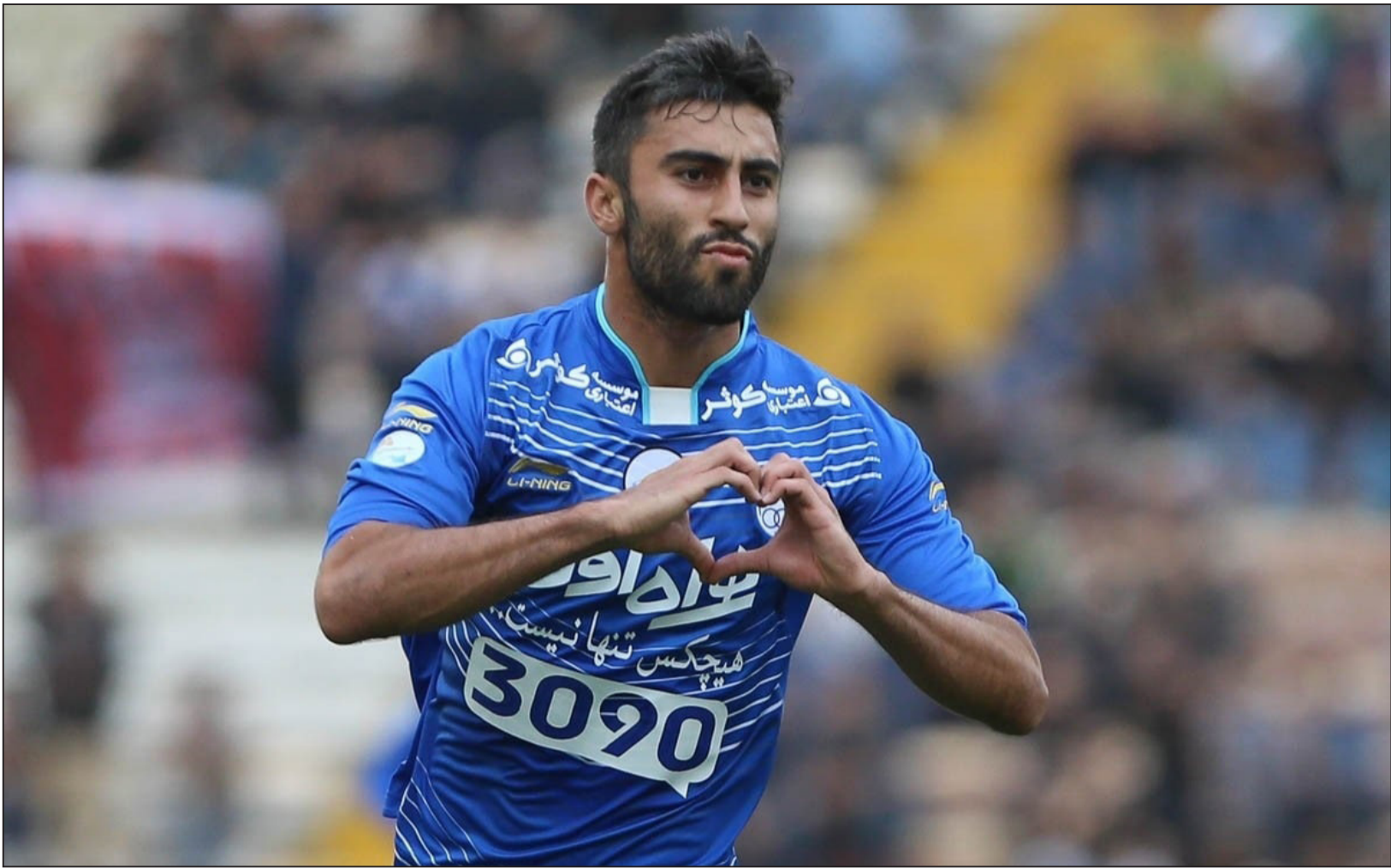
سایپنتو او کی داد، آچور لو اقدام کرد

تیم ملی هندبال جوانان دختر ایران با کسب عنوان نایب قهرمانی در مسابقات قهرمانی آسیا موفق به کسب سهمیه رقابت‌های قهرمانی جهان ۲۰۲۲ به میزبانی اسلووینی شده بود. این برای نخستین بار در تاریخ هندبال ایران است که تیم ملی جوانان دختر ایران به مسابقات قهرمانی جهان راه پیدا کرده است.