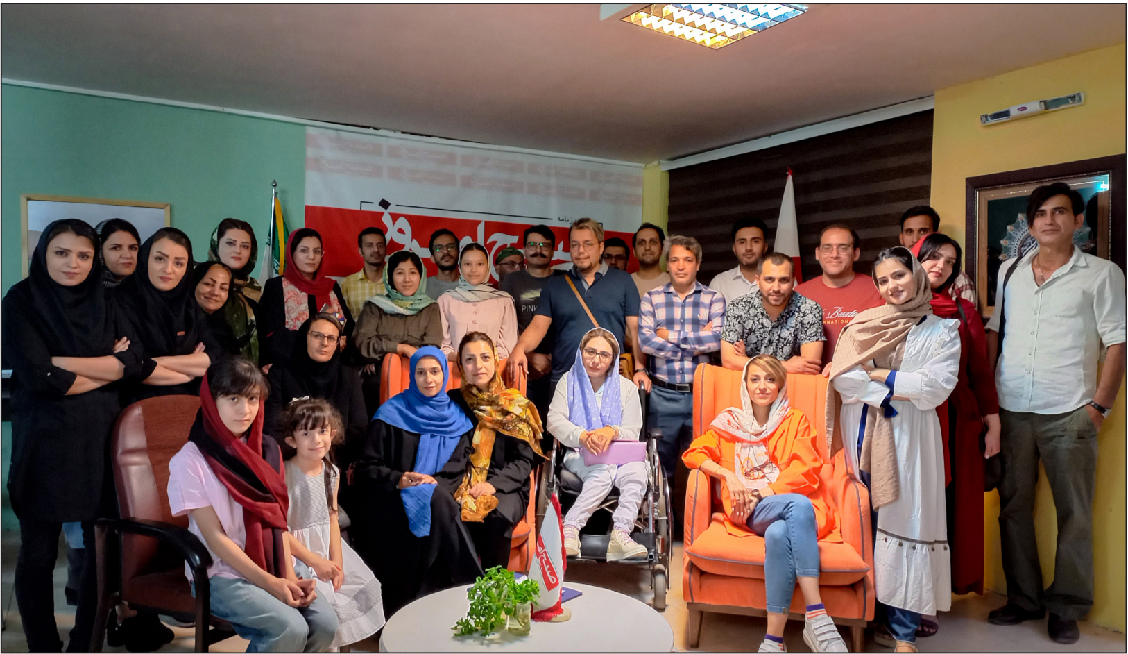
میزبانی «صبح امروز» از هشتمین نشست «پاراگراف»

داده‌های گوگل ترند (یکی از سرویس‌های رایگان شرکت گوگل که میزان جست‌وجوی موضوعات مختلف را به تفکیک کشور و حتی شهر استخراج می‌کند) نشان می‌دهد که «متروپل آبادان»، «سریال یاغی»، «روز دختر»، «ولادت امام رضا(ع)»، «جومونگ»، «الهام چرخنده»، «توهین عنکبوت مقدس»، «پارانه خرداد»، «ابله میمون»، «سعید پورصمیمی»، «انتحانات خرداد» و «فرقه کشتی خورده»، بیشترین واژه‌های جست‌وجوشده در گوگل توسط ایرانی‌ها در خردادماه ۱۴۰۱ بوده است.