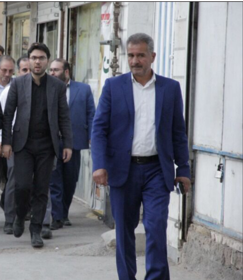
استاندار خراسان رضوی:

وی ادامه داد: خریداری این دام‌ها با هدف فروش، ذخیره‌سازی و صادرات انجام می‌شود تا دامداران حمایت شود.