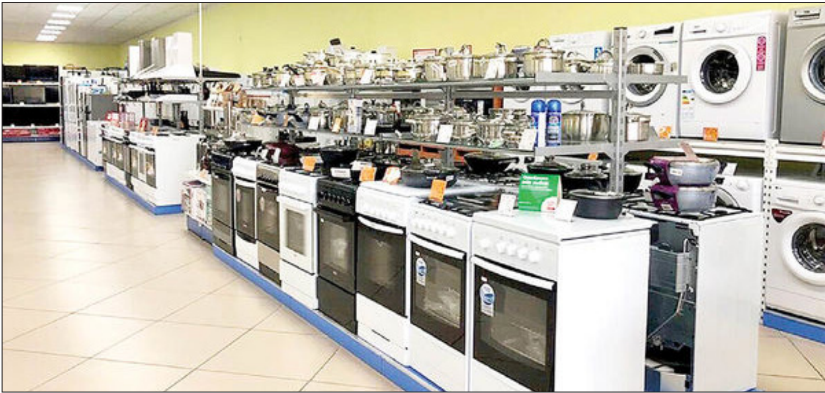
درخواست افزایش قیمت لوازم خانگی؛

این گزارش نشان می دهد که موجودی کالاهایی که روی شناورها قرار دارد به بیش از ۹۰۰ هزار تن می رسد. این میزان در ۱۳ شناور کنار اسکله با حدود ۲۱۷.۹ هزار تن شامل ذرت، گندم، سویا، شکر، روغن، دانه های روغنی و برنج قرار دارد. همچنین ۱۳ شناور دیگر در لنگرگاه منتظر تخلیه هستند که حدود ۶۸۳.۶ هزار تن کالای اساسی شامل ذرت، روغن، گندم، سویا، دانه های روغنی، جو و روغن را با خود حمل می کنند.