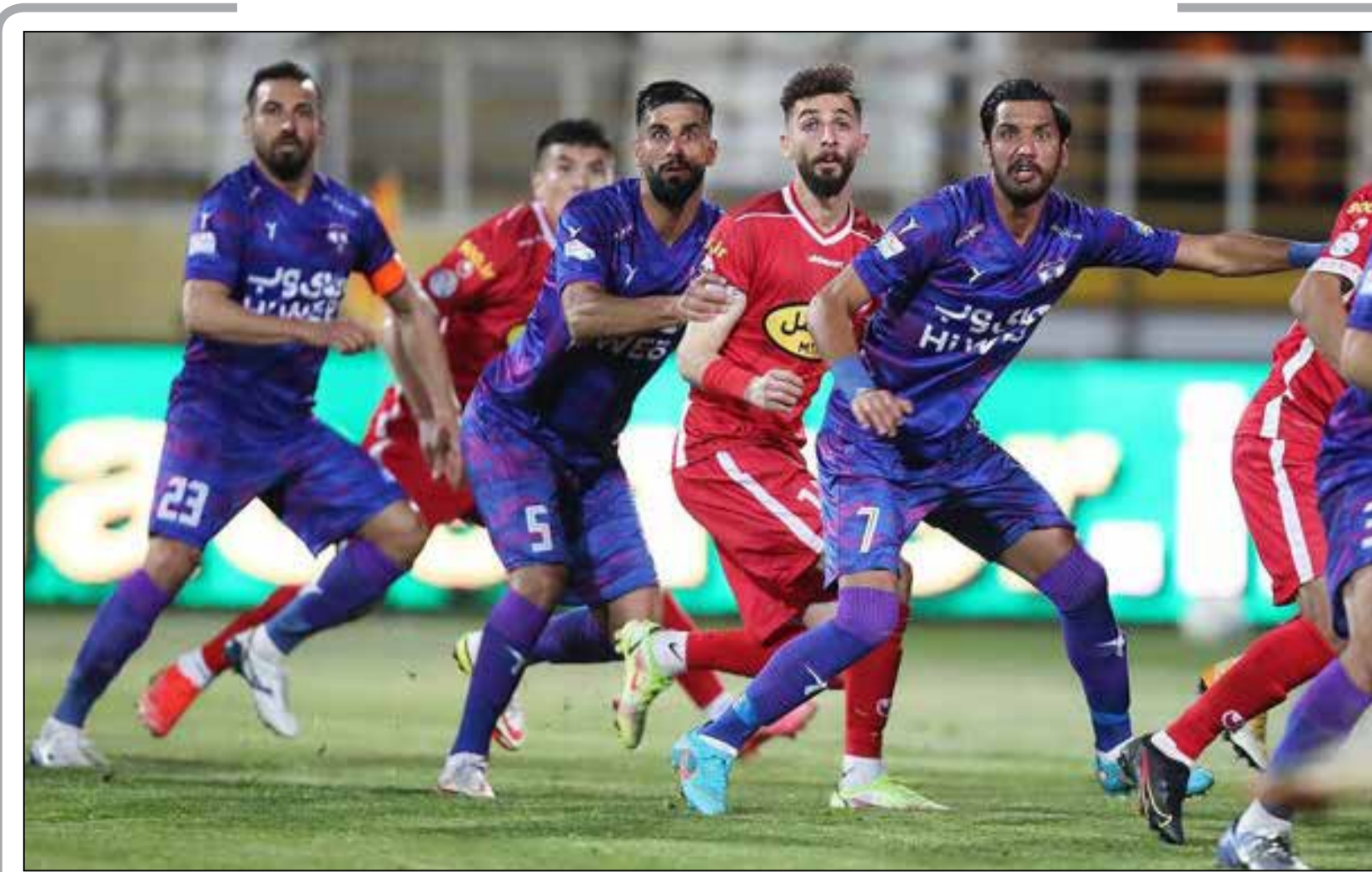
تساوی ناامیدکننده پرسپولیس برابر یک استقلال

به گزارش خبرنگار مهر، فدراسیون کشتی روز گذشته در نامه‌ای به وزارت ورزش و جوانان، اعتراض شدید خود را نسبت به عدم مسئولیت پذیری ستاد مبارزه با دوپینگ اعلام کرد و مدعی شد تا رفع نشدن مشکل مذکور، هیچ گونه همکاری با نادو نخواهد داشت. کشتی ایران در سال گذشته میادین مهمی از جمله قهرمانی آسیا در منولستان (اواخر فروردین ماه ۱۴۰۱)، رقابت‌های جهانی صربستان (۱۹) تا ۲۷ شهریورماه (۱۴۰۱) و بازی‌های آسیایی چین (۳۰ شهریورماه تا ۲ مهرماه ۱۴۰۱) را پیش رو دارد.