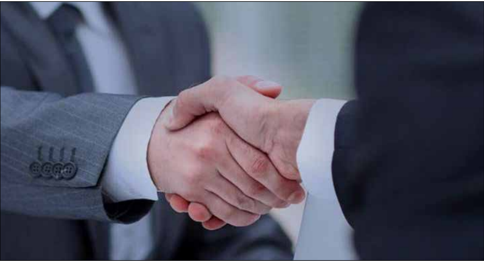
گزارشی از یک آیین دیرینه که به کاهش پرونده‌های دادگاه‌ها کمک کرده است: