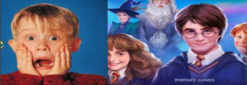
نگاهی به حال و آینده شبکه کودک