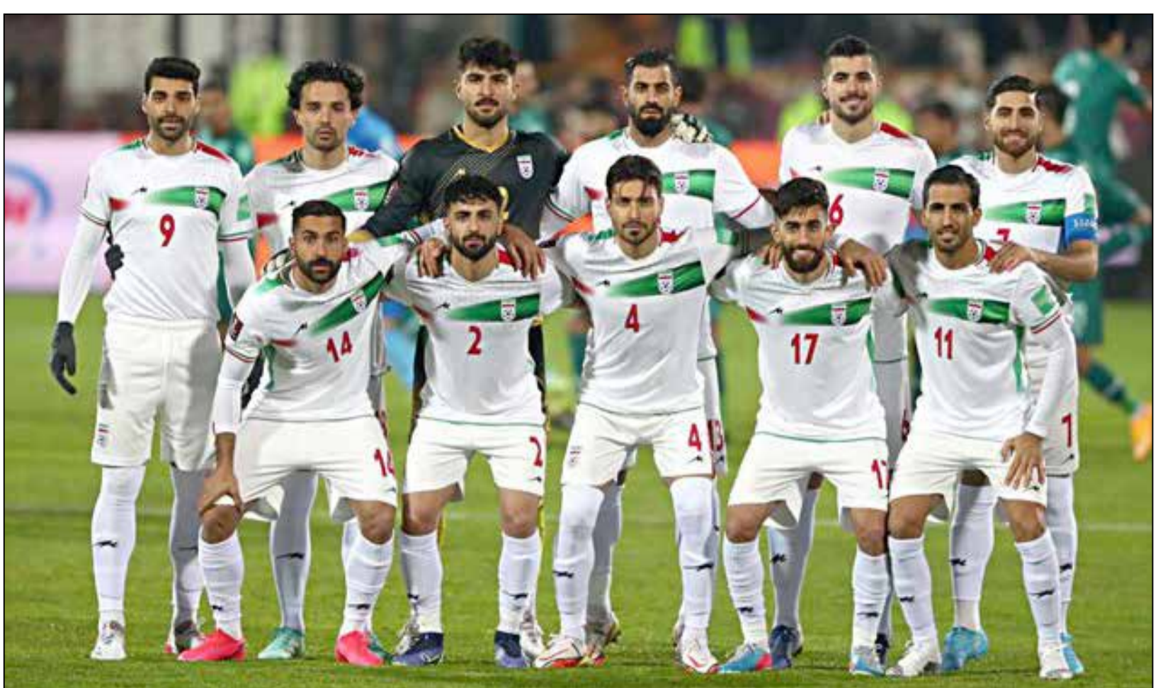
انتخابی جام جهانی

از سوی دیگر باشگاه پورتو در هفته‌های گذشته سه بازیکن اصلی خود یعنی «خوسوس کرون»، «سرجیو اولیویرا» و «لوئیس دیاز» را از دست داده است و بعید به نظر می‌رسد سرمربی و مدیران پورتو اقدام دیگری در نقل و انتقالات برای فروش بازیکنان خود انجام بدهند. مهدی طارمی در حال حاضر در اردوی تیم ملی ایران حضور دارد و فردا با این تیم به مصاف امارات می‌رود.