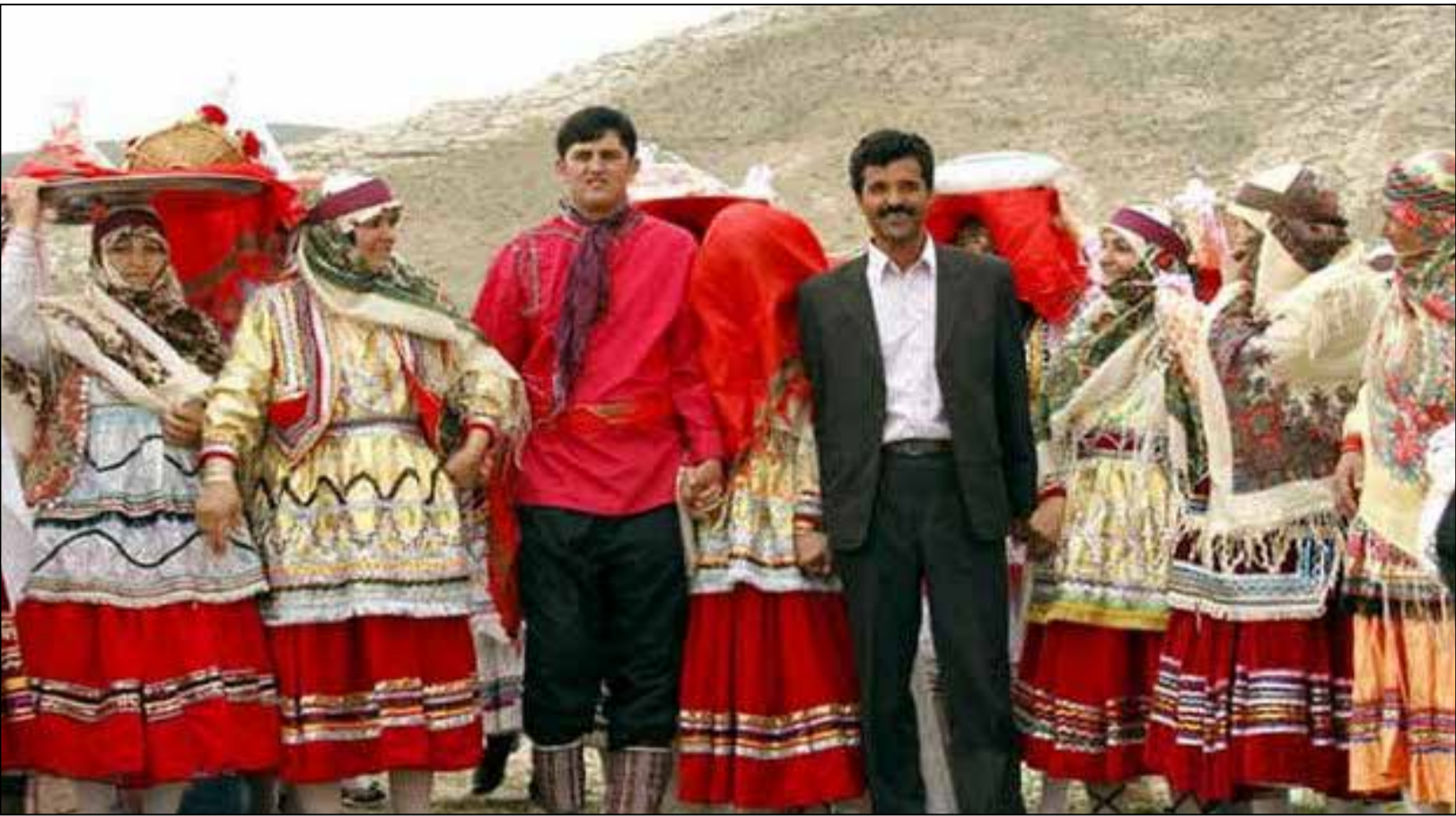
گردشگری عشایری در خراسان شمالی؛

معاون سیاسی، اجتماعی و امنیتی فرماندار تربت حیدریه گفت: ۷۰ مدرسه ابتدایی و ۳۰ مدرسه متوسطه در این شهرستان به دلیل شیوع سویه اومیکرون کرونا تعطیل شده و کلاس‌های دانش‌آموزان این مدارس برای مدت ۲ هفته به صورت غیرحضوری برگزار می‌شود.سیدعلی اومیکرون کرونا تعطیل شد و گو با خبرنگار ایرنا افزود: وقتی در یک مدرسه ۲ دانش آموز به کرونا مبتلا شوند طبق شیوه نامه ستاد ملی کرونا آن مدرسه باید ۱۴ روز تعطیل شود.وی اظهار کرد: بعد از ۲ هفته با بررسی دوباره شرایط سلامت دانش آموزان این مدارس، اگر نیاز به تمدید باشد اقدام شده و در غیر این صورت آموزش حضوری از سرگرفته می شود.وی ادامه داد: مهم‌ترین عامل کاهش و قطع زنجیره انتقال ویروس کرونا، واکسیناسیون عمومی، تزریق به موقع واکسن و رعایت پروتکل های بهداشتی است و از مردم تقاضا داریم دستورالعمل های بهداشتی را رعایت کنند.معاون سیاسی، اجتماعی و امنیتی فرماندار تربت حیدریه بیان کرد: تزریق واکسن کرونا به کودکان بالای ۹ سال در این شهرستان آغاز شده است که انتظار می رود والدین به این موضوع اهمیت بدهند.