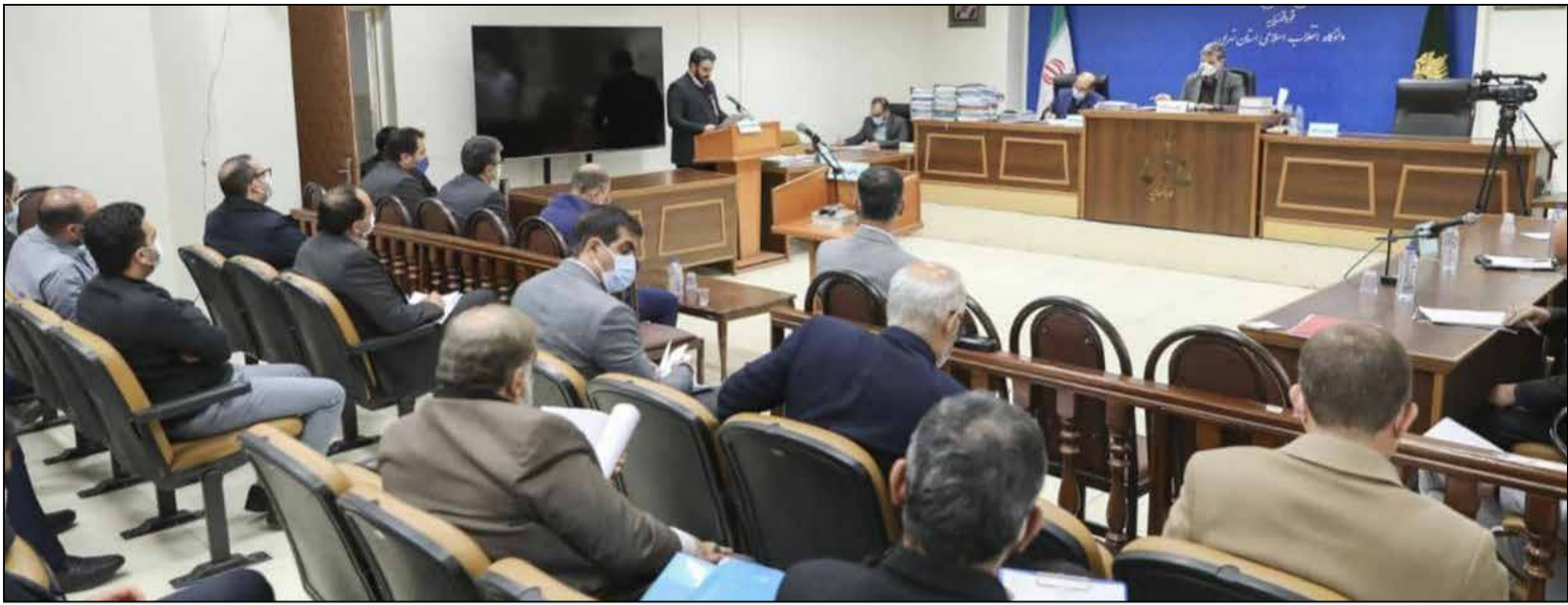
جزئیات باور نکردنی دادگاه کرووز

وی در ادامه راه‌اندازی سامانه یکپارچه سازی نانوبی‌ها از ۲۵ بهمن ماه را اتفاق خوبی در روند رسیدگی و نظارت بر نانوبی‌ها دانست و افزود: با تدابیر اتخاذ شده در حمل آرد به نانوبی‌های سطح استان با مشکلی مواجه نمی‌باشیم.