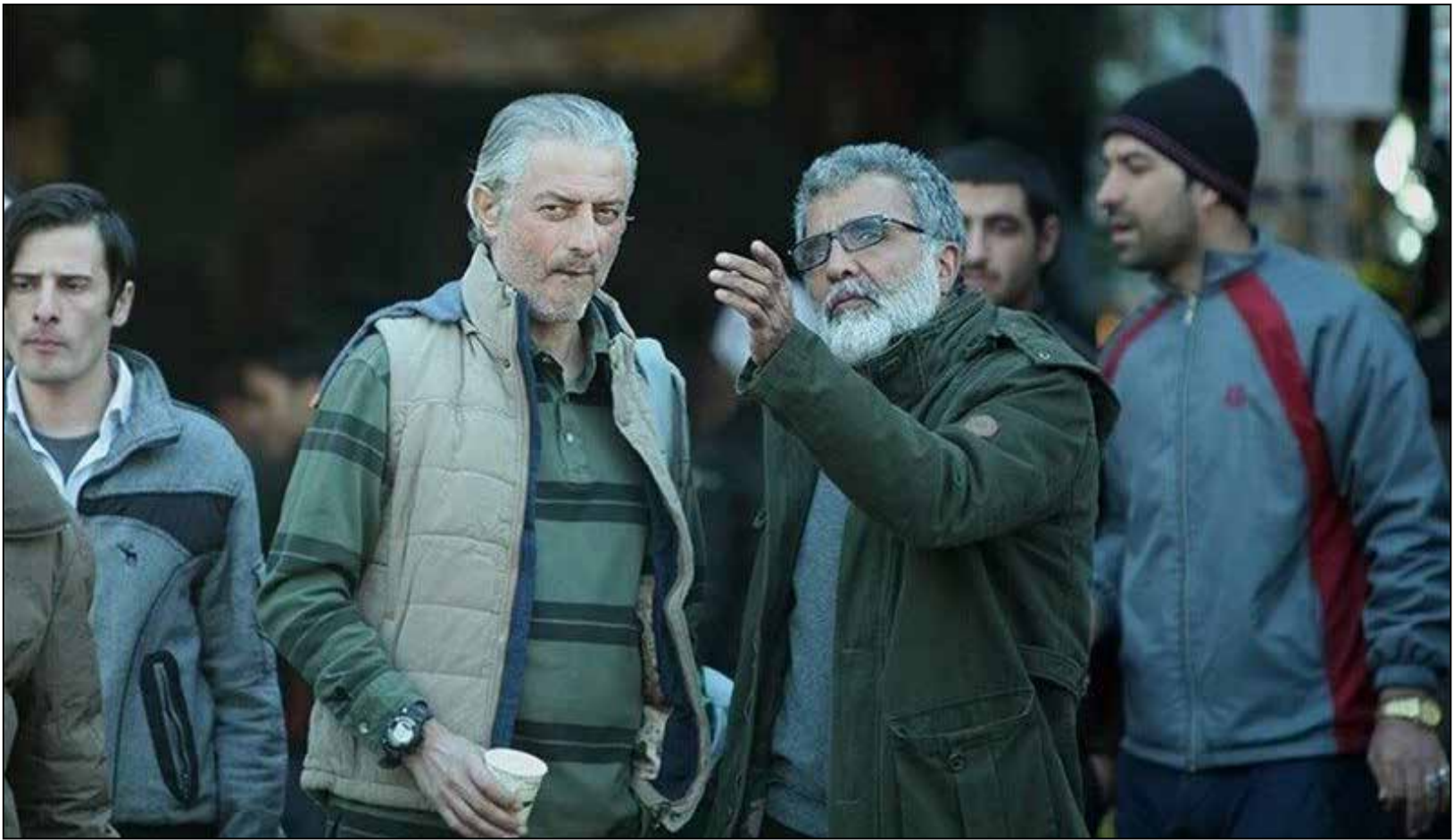
هنر نمایی افخمی و شبکه ۵ در معلق نگه داشتن یک سریال

سلیمان زاده تنها منتقد ایرانی در تاریخ سینمای ایران است که تاکنون تجربه داوری سه جشنواره مهم سینمای جهان از جمله گولدنبرگ سوئد، کن فرانسه و برلین آلمان را در برونده خود دارد.