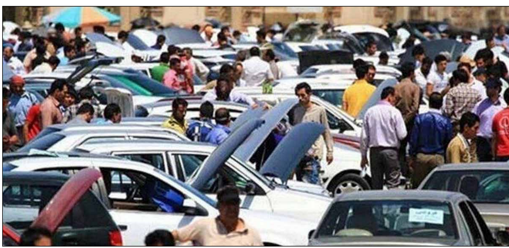
بررسی اثرات حذف ارز ترجیحی بر قیمت خودرو؛

با توجه به بند ۳۳ سیاست‌های کلی اقتصاد مقاومتی مبنی بر ضرورت «شفاف و روان سازی نظام توزیع و قیمت‌گذاری و رزماد سازی شیوه‌های نظارت بر بازار» و همچنین ایجاد رقابت، تعدیل و واقعی نمودن قیمت‌ها، اصلاح نظام توزیع کالا و جلوگیری از سوءاستفاده احتمالی ضروری است، کلیه واحدهای صنفی توزیع‌کننده از تاریخ ۱۴۰۰/۰۹/۲۷ از خرید کالاهای آب معدنی، آب میوه، ماہ‌الشعیر، نوشابه‌های گازدار، غذاساز، نوشیدنی‌های سرد، چرخ گوشت و ماکروویو و از تاریخ ۱۴۰۰/۰۸/۰۴ پودر لباسشویی، دستمال کاغذی، پوشک بچه، یخچال فریزر، تلویزیون و ماشین لباسشویی بدون درج قیمت تولیدکننده بر روی بسته بندی خودداری و نسبت به نصب برچسب قیمت فروش با لحاظ سود و هزینه‌های مصوب به منظور شفاف‌سازی اقدام کنند.