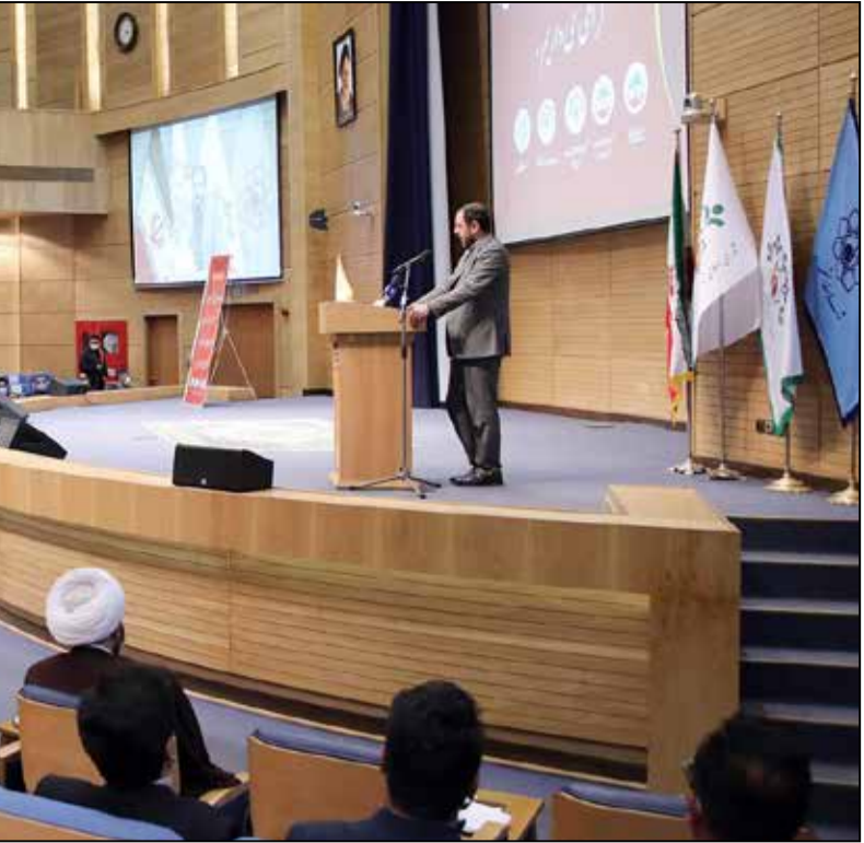
در نشست شورای عالی استانها در مشهد مطرح شد

احمدی افزود: این سه متهم زورگیر در اظهارات خود به سرقت ۱۶ فقره گوشی تلفن همراه اعتراف کردند که تمامی سرتقها با ۲ دستگاه موتورسیکلت پلاک مخدوش انجام شده است. کاشمر در فاصله ۲۲۸ کیلومتری جنوب غرب مشهد قرار دارد.