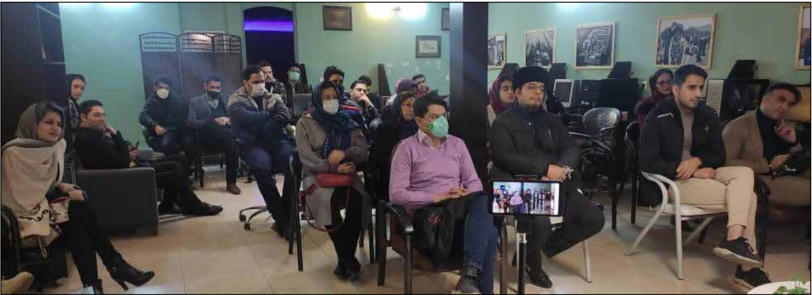
سومین جلسه از نشست ادبی «پاراگراف» در دفتر روزنامه «صبح امروز»؛

حسن تنابنده برای نقش آفرینی در فیلم «سه کام حس» ساخته سامان سالور برنده جایزه بهترین بازیگر مرد جشنواره شد و همچنین فیلم کوتاه «سفید پوش» ساخته رضا رحیمی بهترین فیلم کوتاه بین‌الملل نام گرفت و «باغ پادشاه» ساخته ایرج محمدی رزینی جایزه بهترین انیمیشن کردی و خارجی را به خود اختصاص داد. فیلم سینمایی «مهوریا» ساخته «ویجاتیوتوبک ویراستاکول» کارگردانی تابوانی هم دو جایزه بهترین کارگردانی و بهترین فیلم از نگاه هیات داوران را به خود اختصاص داد.