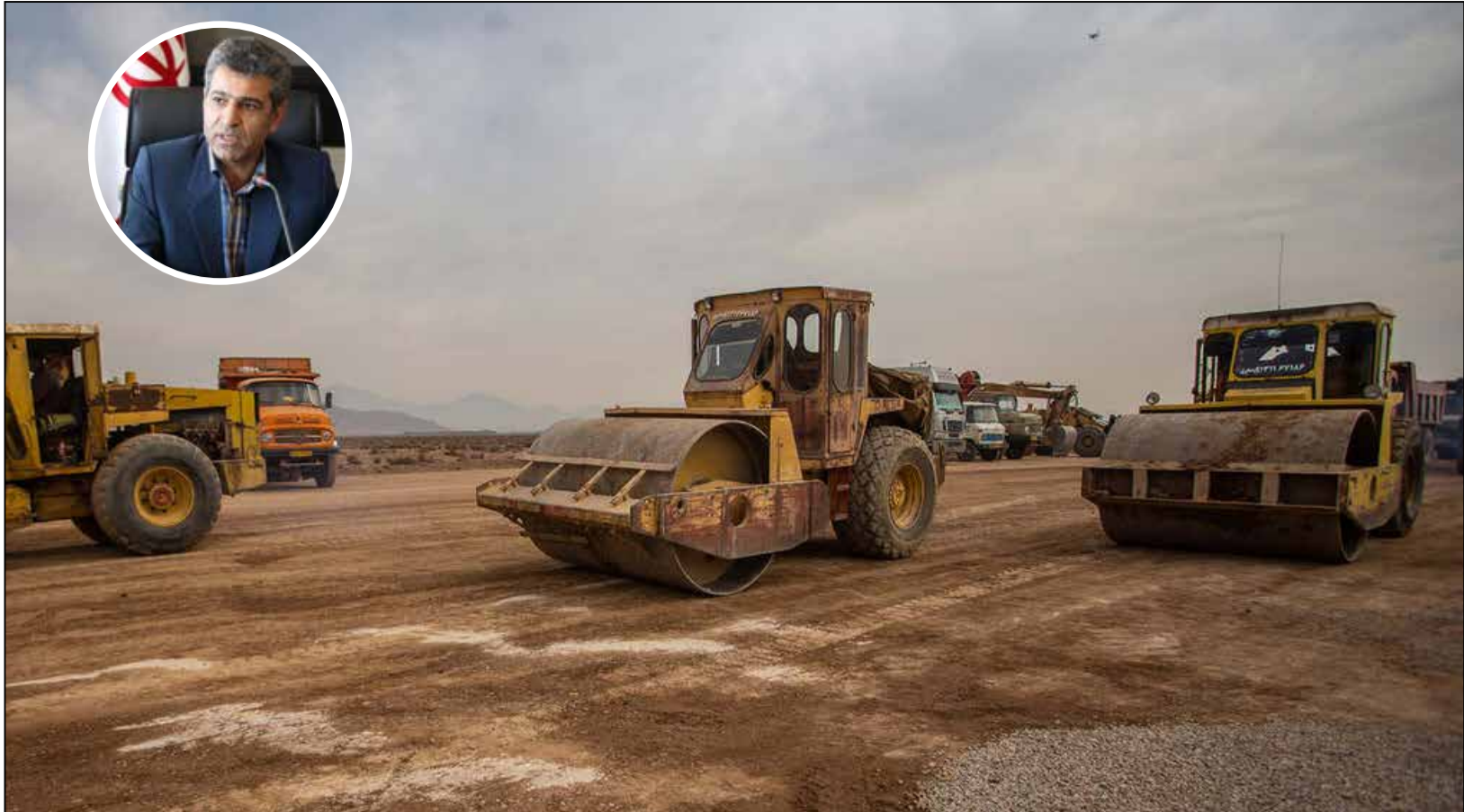
رئیس سازمان مدیریت و برنامه‌ریزی خراسان شمالی:

امکان حذف و جایگزینی باغ‌های آب‌پر با زعفران، سهولت در کشت مکانیزه و ارزش اقتصادی بالا، سهولت در نگهداری محصول، وجود پنج واحد فرآوری و بسته‌بندی زعفران با ظرفیت سالانه ۳۴ تن و امکان صادرات آن از جمله مزایای کشت این محصول در خراسان شمالی است.