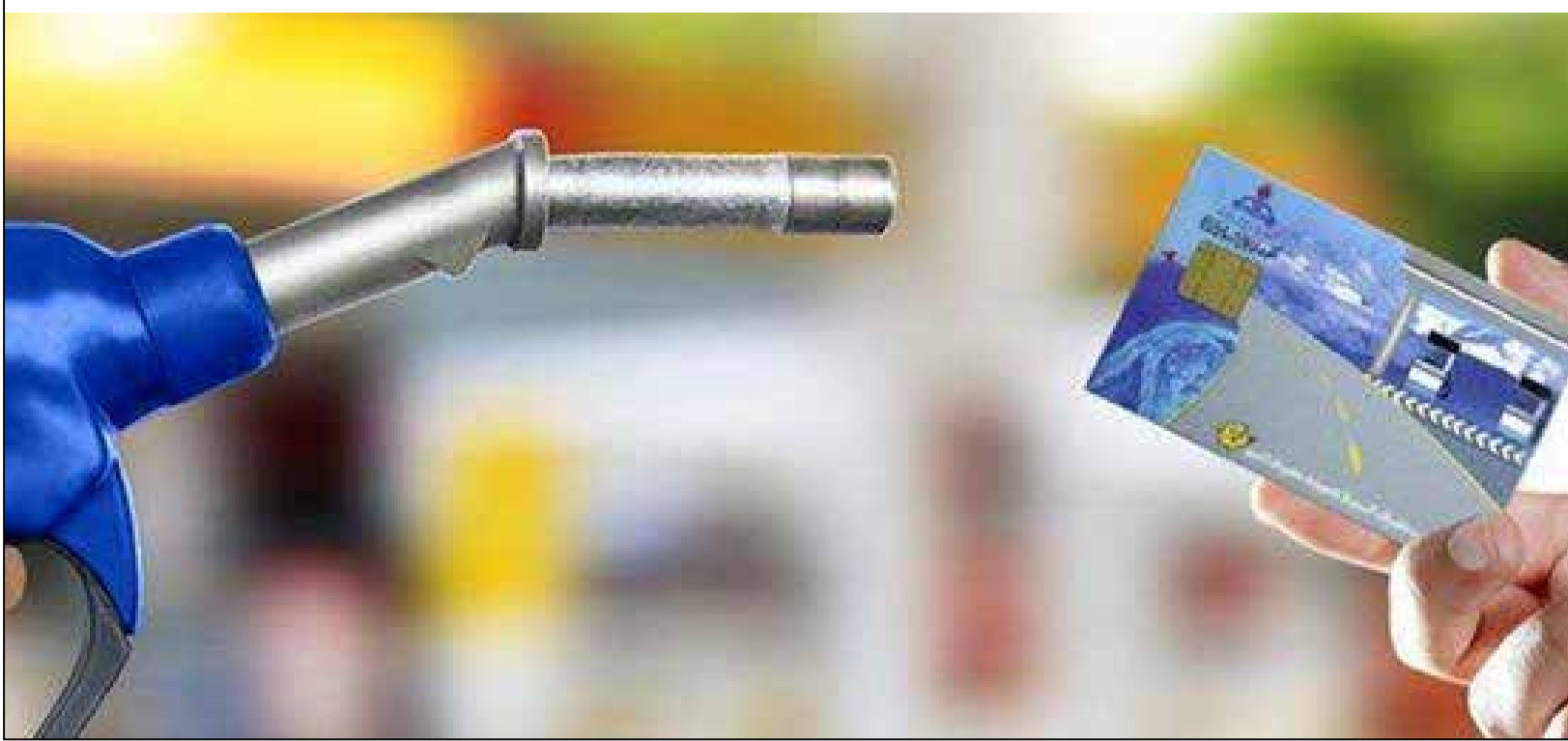
«صبح امروز» ماجرای تغییر در شیوه سهمیه بندی و اصلاح قیمت این سوخت را بررسی می‌کند

«ابتدا حقوق و دستمزد را اصلاح کنید، سپس بنزین را» همچنین یک عضو دیگر کمیسیون انرژی مجلس شورای اسلامی در گفتگو با ایسنا تأکید کرد: به عقیده بنده در ابتدا نظام حقوق و دستمزد در کشور باید اصلاح شود سپس در خصوص توزیع یارانه‌ها در قالب لایحه بودجه و در مجلس تصمیم‌گیری شود.