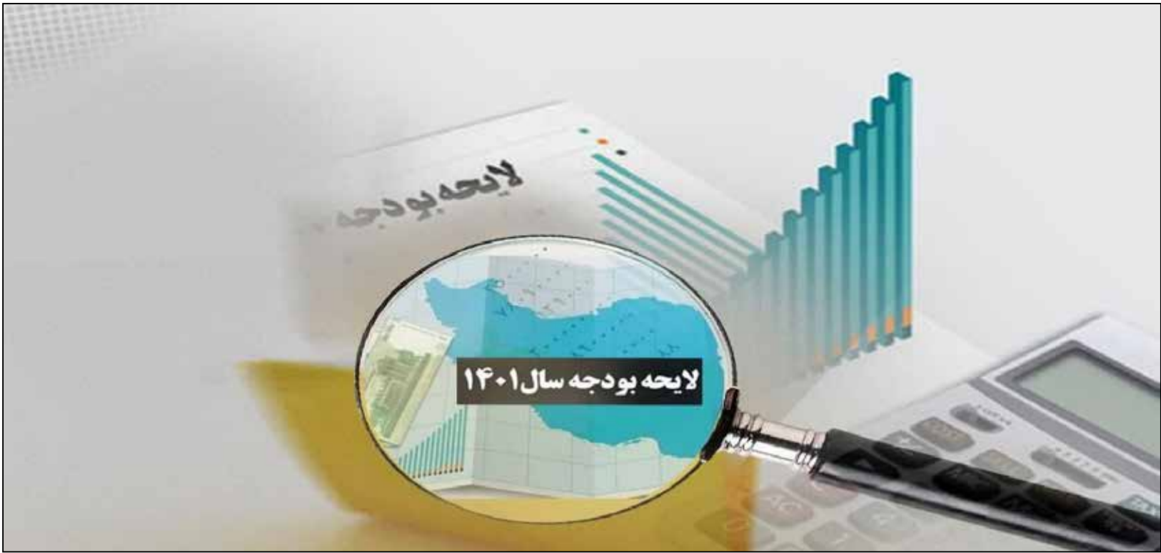
«صبح امروز» لایحه بودجه ۱۴۰۱ را بررسی می کند؛