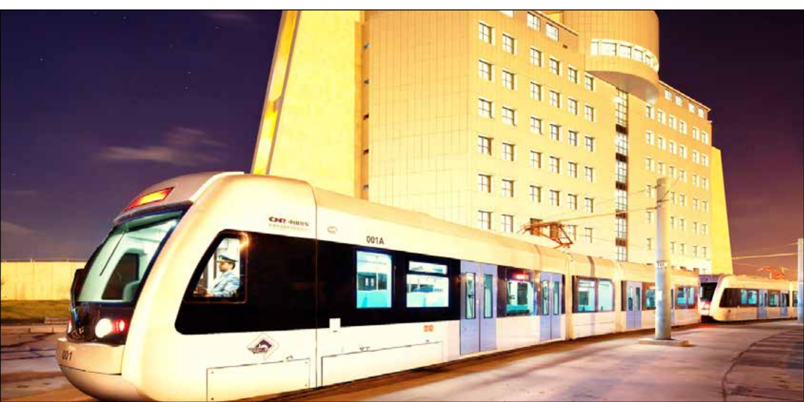
در نشست خبری رئیس کمیسیون عمران، حمل و نقل و ترافیک شورای اسلامی شهر مطرح شد:

طرح «انضباط ترافیکی» جهت روان سازی ترافیک، فرهنگ سازی و احقاق حقوق شهروندی با همکاری پلیس راهور و اداره حمل و نقل و ترافیک شهرداری منطقه ۶ به اجرا درآمد. به گزارش صبح امروز، طرح «انضباط ترافیکی» جهت روان سازی ترافیک، فرهنگ سازی و احقاق حقوق شهروندی با همکاری پلیس راهور و اداره حمل و نقل و ترافیک شهرداری منطقه ۶ به اجرا درآمد. در این طرح ابتدا از طریق نصب پنهان رسانی در سطح معابر، توزیع تراکت های آموزشی و اختطاب به رانندگان متخلف توسط اداره ترافیک منطقه، از تخلفاتی شامل توقف خودروها در مسیرهای دوچرخه، پیاده راه، گذرگاه های عابر پیاده و ایستگاه های اتوبوس و توقف دوبله جلوگیری خواهد شد و در مرحله دوم طبق قانون خودروهای متخلف جریمه خواهند شد. در حال حاضر این طرح به صورت پایلوت در دو معبر پر تردد حر و مصلی در منطقه ۶ در حال اجرا است.