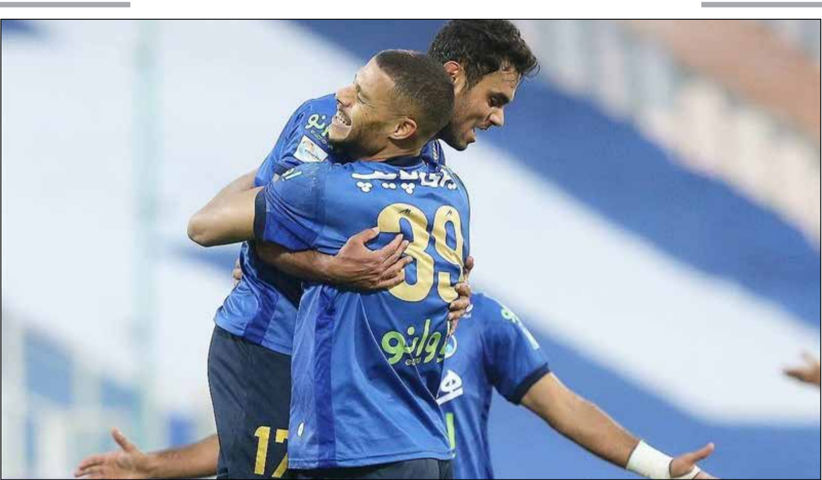
استقلال یک – سپاهان صفر