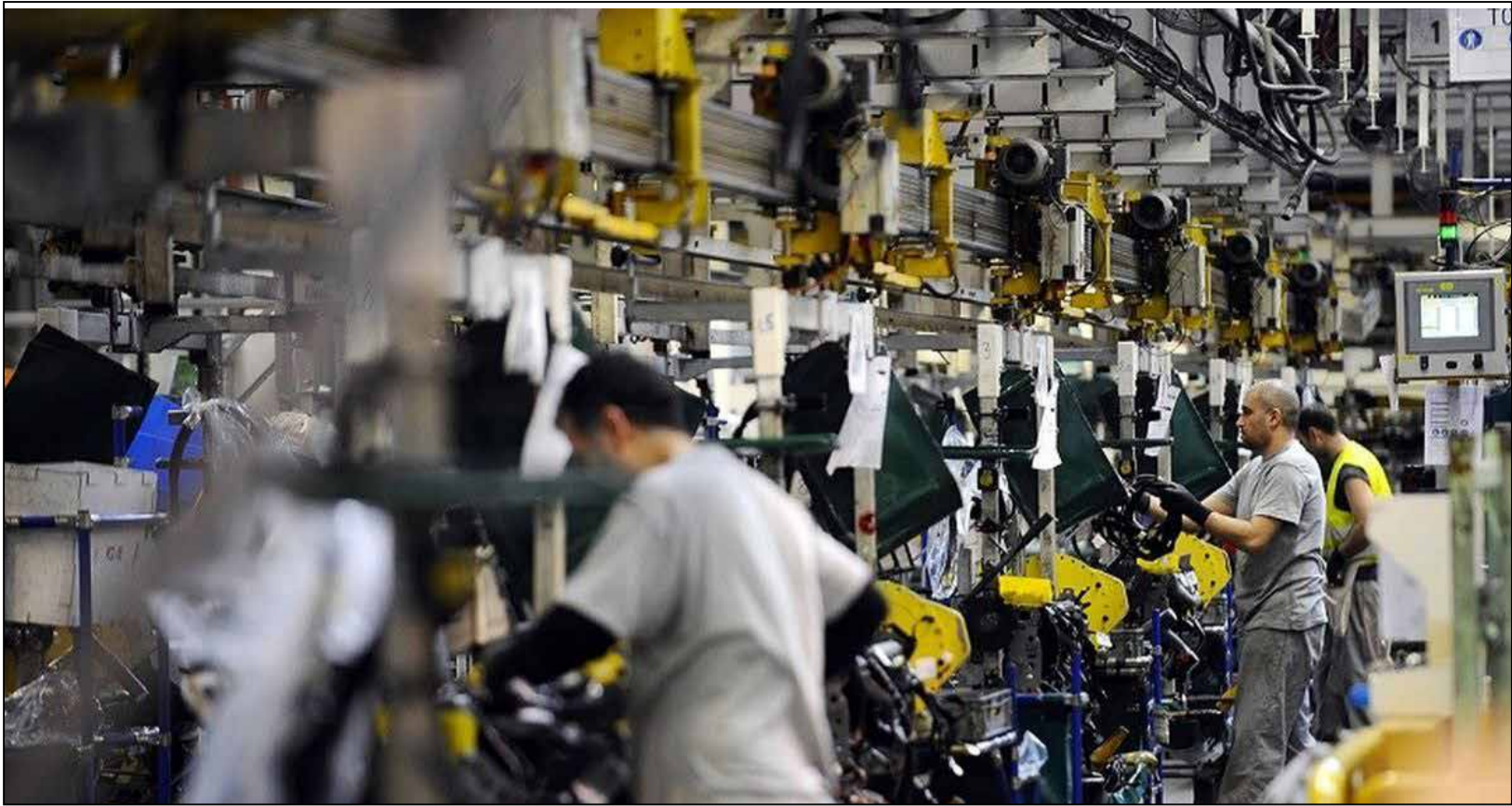
بررسی راهکارهای تأمین مالی صنایع در بودجه سال آتی؛

پیش از سه سال از ممنوعیت واردات لوازم خانگی به کشور می‌گذرد، اما در ماه‌های اخیر این ممنوعیت حواشی به‌دنبال داشته؛ برای مثال استانداری از ثبت سفارش لوازم خانگی منتشر شد. در نهایت اعلام شد واردات مرزنشینی و کولبری به دلیل مسائل معیشتی مشمول ممنوعیت و محدودیت‌ها نیست، حالا به نظر می‌رسد با دستور اخیر مقام معظم رهبری مبنی بر ممنوعیت واردات لوازم خانگی خارجی به ویژه کرم‌های و اظهارات تولیدکنندگان مبنی بر سوء استفاده از واردات لوازم خانگی به روش مرزنشینی، قوانین جدید وضع شده است.