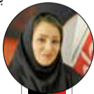
فرماندهی نیروی هوایی

بیش از یک دهه از عمر شبکه نمایش خانگی و سریال سازی در آن می‌گذرد و در این مدت در کنار آثار نضفه و نیمه و بعضاً ضعیف، آثار محبوب و پر مخاطب نیز کم نبوده است. برای اثبات این موضوع نیز می‌توان به آمار تولید، توزیع و