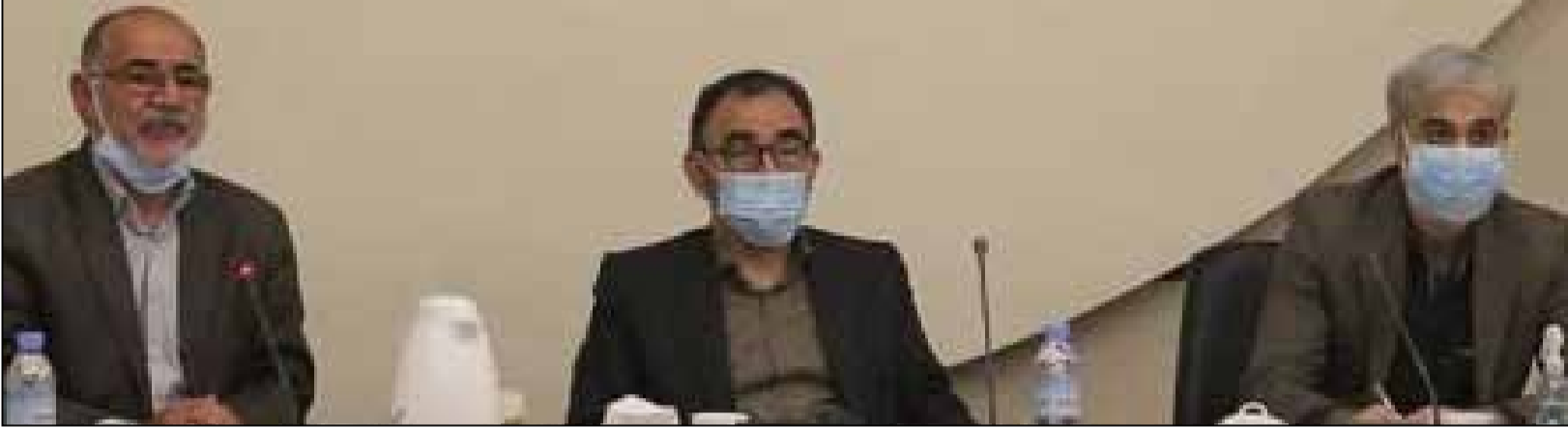
برنامه استان خراسان رضوی در نهضت ملی مسکن اعلام شد