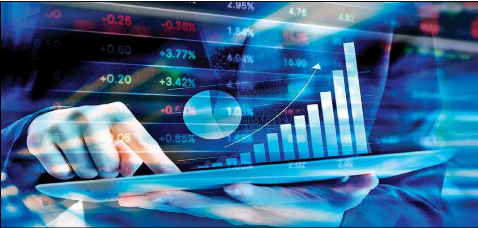
اخبار خوب برای سرمایه‌گذاران بازار سرمایه؛