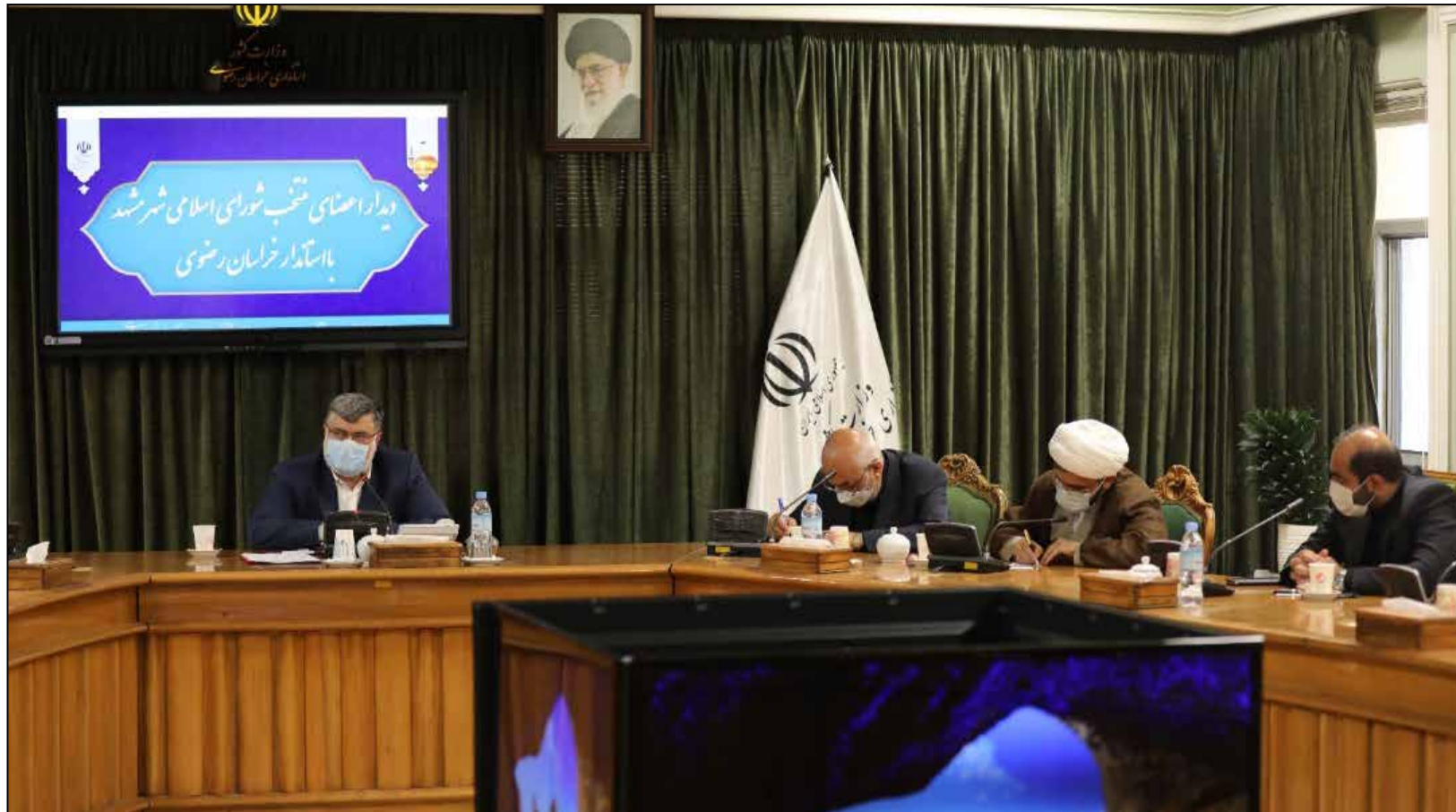
استاندار خراسان رضوی تاکید کرد:

وی از تلاش ها و همکاری های مؤثر همه افرادی که در این طرح بزرگ مشارکت داشته اند خصوصا از مشاوران، کارشناسان و مدیران حوزه های تخصصی عمران و حمل نقل بابت همراهی ها و نظرات کارشناسی در مسیر تهیه و تدوین این کتاب ها تشکر و قدردانی کرد و گفت: امیدواریم این کار ارزشمند که در جشنواره ملی از بین ۹۰۴ اثر در ۱۱ محور حائز رتبه اول در محور کتاب مدیریت عمران شهری شده است ادامه داشته باشد و روز به روز بر کیفیت ارائه خدمات و پروژه ها به شهروندان و زائران در شهرداری مشهد افزوده شود.