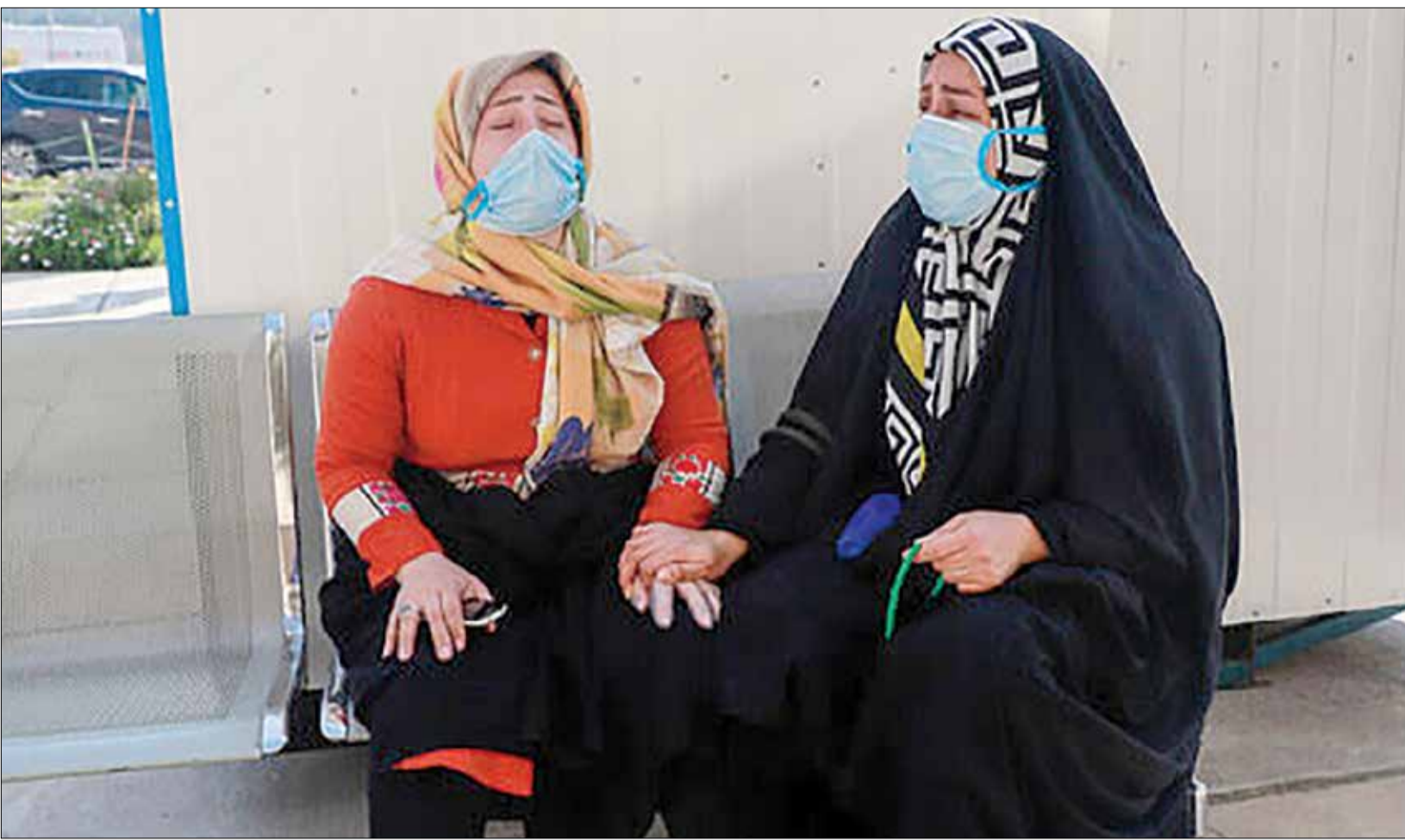
روانشناس مرکز مشاوره دانشگاه تهران پاسخ داد:

عضو کمیسیون بهداشت مجلس شورای اسلامی با بیان اینکه «یکی از اعتراضات بنده به ستاد کرونا این بود که درمان بیماران کرونایی تحت پوشش بیمه‌ها نبود و بصورت آزاد این امر انجام و فرد متحمل ۴۰ میلیون تومان هزینه درمان می‌شد، افزود: خوشبختانه به کمک وزیر و شورای عالی بیمه‌ها تصویب شد که زین پس تمام دارو و درمان بیماران کرونایی و حتی اقلام یکبار مصرف مورد نیاز آنها تحت پوشش بیمه‌ها قرار گیرد. در حال حاضر مشکل آنجانی برای درمان بیماران کرونایی نداریم و به لحاظ دارو نیز محدودیت نداریم.