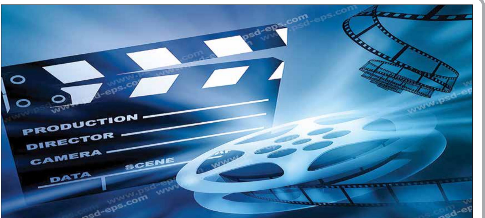
بهترین فیلم‌های گنگستری به انتخاب منتقدان سینمای جهان