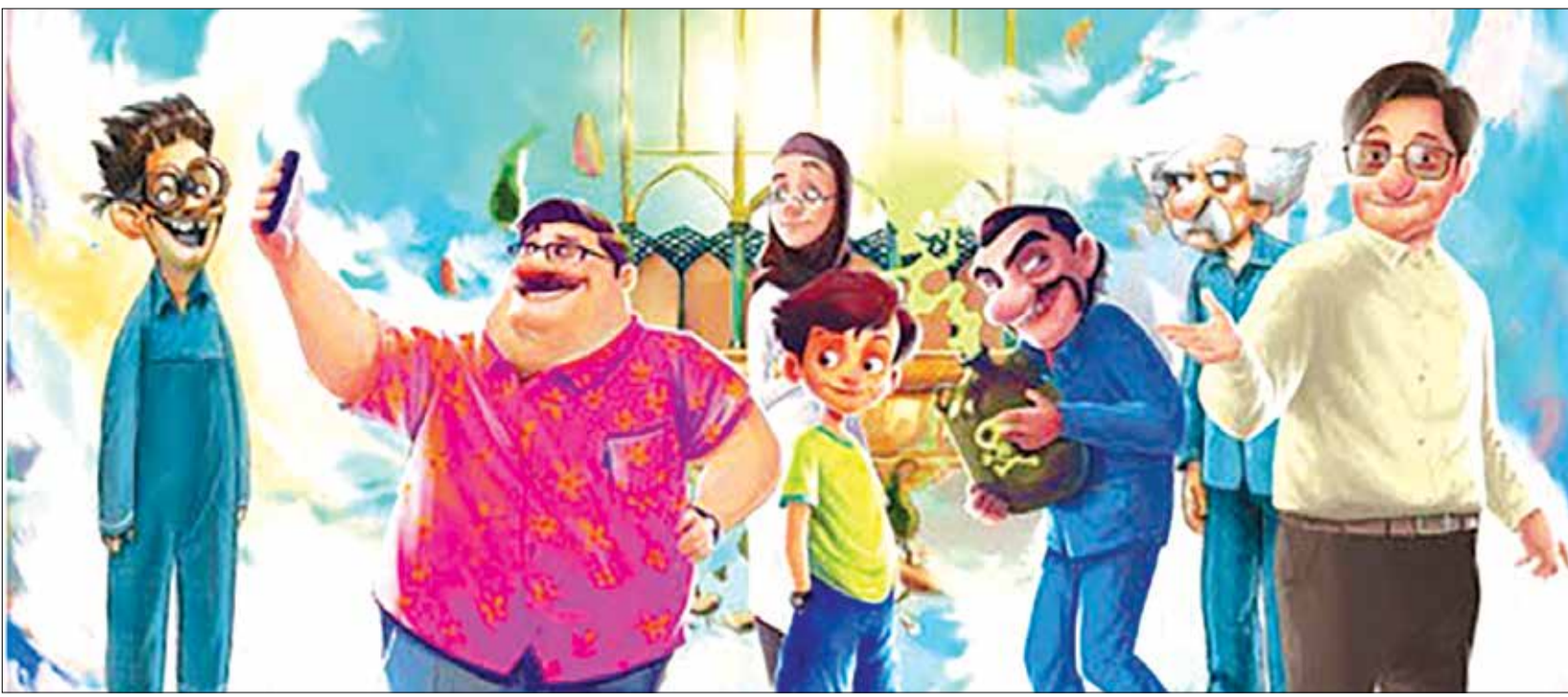
یک تهیه‌کننده انیمیشن سینمایی می‌گوید؛

طرز تشخیص مواد رنگزای اسیدی لولینگ: در دمای ۵۰-۴۰ درجه بیشترین رمق کشی انجام می‌گیرد. در محیط اسیدی قوی (PH= ۳-۲/۵) جذب کامل شود. در دمای جوش بخشی از ماده رنگزا طرد می‌گردد. چنانچه کالای رنگ شده با مقداری کالای رنگ نشده در حمام قرار داده شود، کالای رنگ شده نیز کاملاً رنگی خواهد گردید. استفاده از این گونه مواد رنگزا صرفاً برای مواقعی است که کالای مورد نظر بندرت شسته شود. نکته مهم: برای رنگرزی مواد اولیه مورد نیاز فرش دستبافت و انواع گلیم هیچگاه از اینگونه مواد رنگزا استفاده نفرمایید.