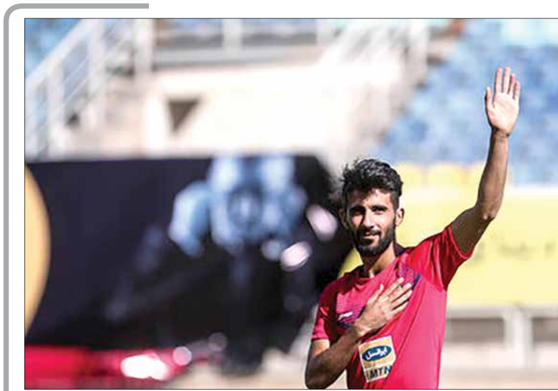
موضع باشگاه پرسپولیس اعلام شد