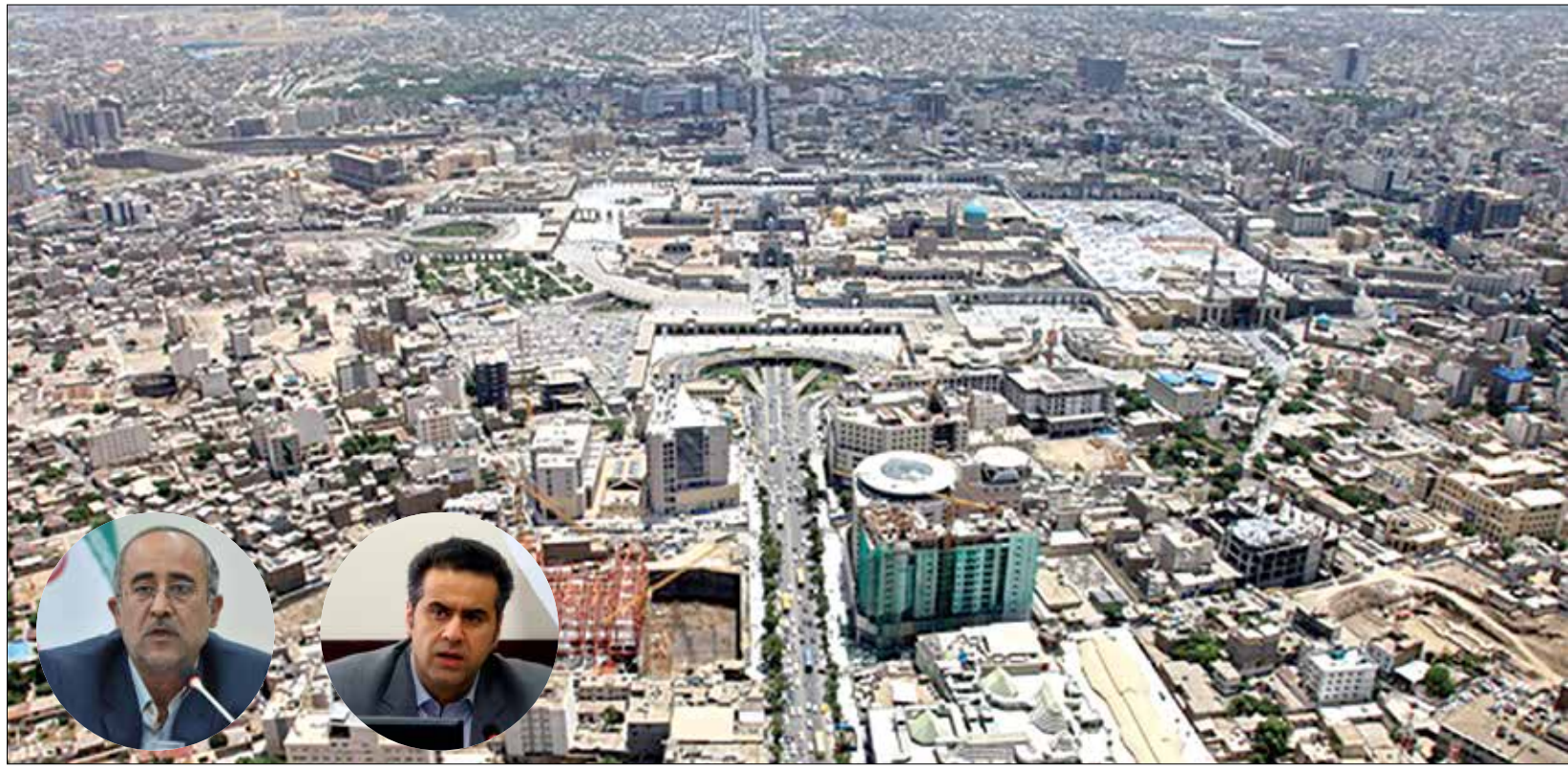
رئیس کمیسیون شهرسازی و معماری شورای شهر مشهد خبر داد:

سند و برگ سبز خودرو سواری پراید مدل جی تی ایکس آی مدل ۱۳۸۶ به شماره پلاک ۲۷۶ ۹۱۱ ل ۳۲ شماره موتور ۲۱۶۹۸۳۷ شماره شاسی ۳۳۲۰۳۱۲۲۸۶۴۹۳۲۰۳ مربوط به خانم نجمه معصومی بور مفقود گردیده و از درجه اعتبار ساقط میباشد.