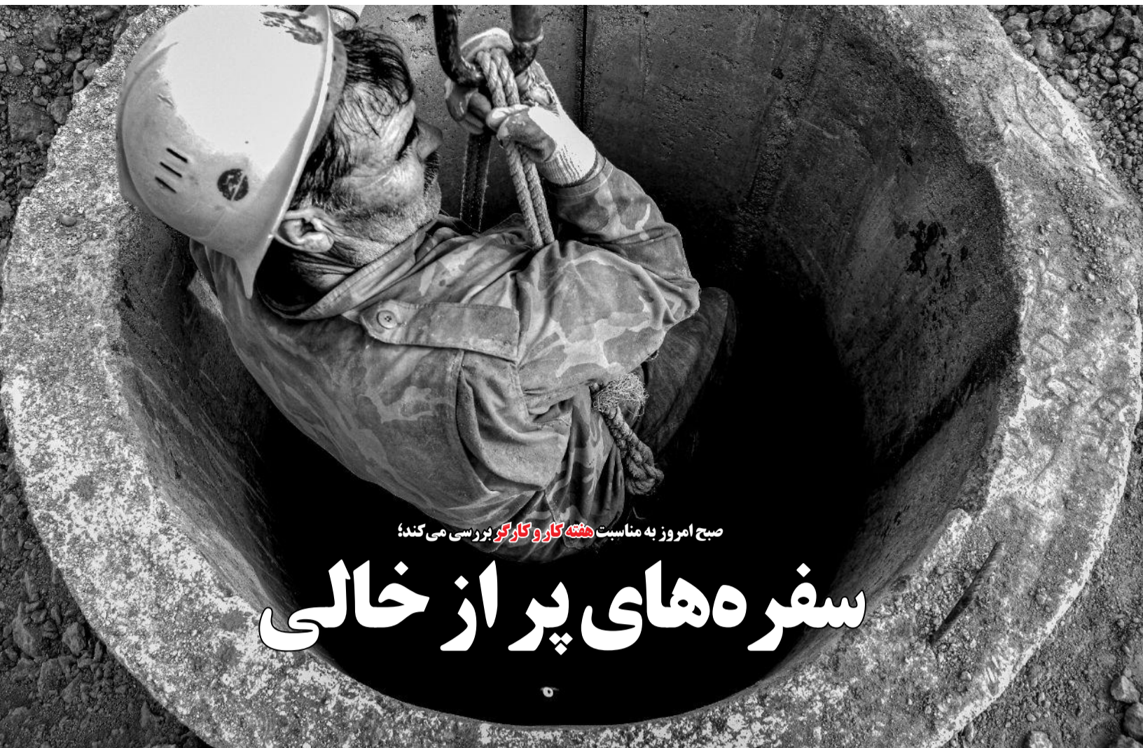
صبح امروز به مناسبت هفته کار و کارگر بررسی می کند؛