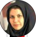
رئیس اتحادیه مرغداران

وی اینطور ادامه داد: به زودی افزایش قیمت خواهیم داشت و تا زمانی که قیمت ها به طور دقیق مشخص نشوند نمی توان وضعیت بازار را پیش بینی کرد. این در حالی است که چند روز پیش، معاون هماهنگی امور اقتصادی استانداری خراسان رضوی از اختصاص ۱۵ هزار و ۲۵۴ تن کالای اساسی طرح تنظیم بازار سهمیه ماه مبارک رمضان به استان، خبر داد و اعلام کرد که این اقلام به زودی در بازار عرضه می شود.