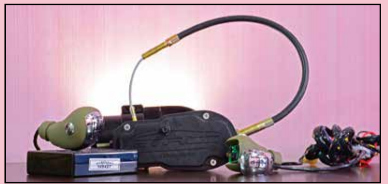
یک مخترع جوان ایرانی خبر داد: