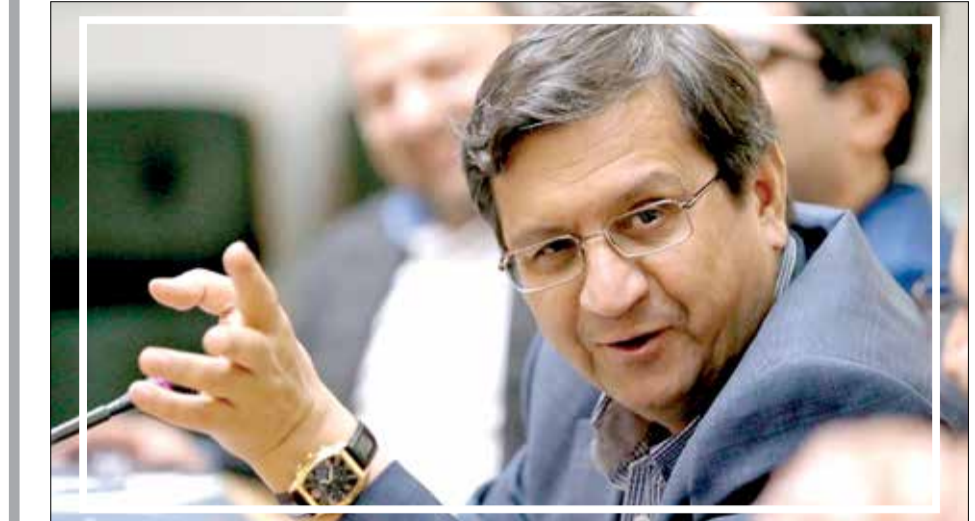
کاشخار مداوم ماهانه تورم توام با مدیریت نقدینگی است. رئیس کل بانک مرکزی در خصوص تأمین ارز توسط بانک مرکزی گفت: آمارها نشان دهنده تأمین ۲۴ میلیارد دلار در سال جاری برای واردات است و این خود موید موفقیت کشور در کاستن از فشار تحریم‌ها است ضمن آنکه روند بازگشت ارز حاصل از صادرات نیز رو به افزایش است.

رئیس کل بانک مرکزی در جلسه اتاق تعاون، بازرگانی و اصناف، از آماده شدن طرح گام (گواهی اعتبار مولد) به منظور حل بخشی از مشکل سرمایه در گردش واحدهای تولیدی خبر داد. عبدالناصر همتی در خصوص طرح گام گفت: کارهای کارشناسی و اخذ دیدگاه‌های صاحب‌نظران انجام شده است و در جلسه آتی شورای پول و اعتبار مطرح خواهد شد. وی افزود: امیدواریم با تصویب این طرح، بخشی از مشکل سرمایه در گردش واحدهای تولیدی رفع و شاهد رونق بیش از پیش تولید باشیم. رئیس کل بانک مرکزی با بیان اینکه شرایط اقتصادی کشور ویژه است، گفت: علیرغم محدودیت‌ها و تحریم‌ها، شاخص‌های اقتصادی در زمینه‌های متعدد از جمله صنعت و کشاورزی مثبت است و لازم است همه ما به آرامش موجود و ثبات