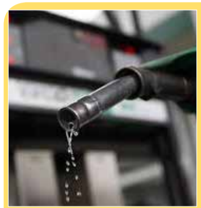
اما در حال حاضر کمبود داریم و مرتب بنزین سوپر به جایگاه نمی‌آید.

رئیس کل بانک مرکزی در جلسه اتاق تعاون، بازرگانی و اصناف، از آماده شدن طرح گام (گواهی اعتبار مولد) به منظور حل بخشی از مشکل سرمایه در گردش واحدهای تولیدی خبر داد. عبدالناصر همتی در خصوص طرح گام گفت: کارهای کارشناسی و اخذ دیدگاه‌های صاحب‌نظران انجام شده است و در جلسه آتی شورای پول و اعتبار مطرح خواهد شد. وی افزود: امیدواریم با تصویب این طرح، بخشی از مشکل سرمایه در گردش واحدهای تولیدی رفع و شاهد رونق بیش از پیش تولید باشیم. رئیس کل بانک مرکزی با بیان اینکه شرایط اقتصادی کشور ویژه است، گفت: علیرغم محدودیت‌ها و تحریم‌ها، شاخص‌های اقتصادی در زمینه‌های متعدد از جمله صنعت و کشاورزی مثبت است و لازم است همه ما به آرامش موجود و ثبات