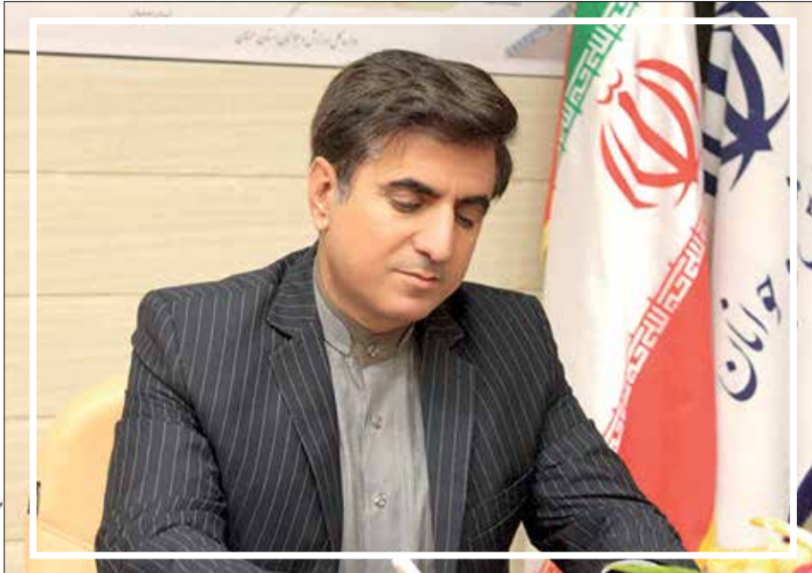
مجموع هیات های ورزشی

صد هجستیم تا پایان سال جاری بیش از یکصد خانه روستایی را با مساعدت شورای هماهنگی ستاد مبارزه با مواد مخدر، روستای هیات از ابتدای سال جاری خبر داد و گفت: مجمع انتخاب ریاست هیات والیبال استان ۲۳ آبان برگزار می شود و سایر مجامع هیات های ورزشی از جمله هیات موتورسواری، بسکتبال، اسکی، بیلیارد و بولینگ، دوچرخه سواری، سوار کاری و بوکس سرپرست معرفی شده است و برخی نیز در شرف ثبت نام اعضا قرار دارند.