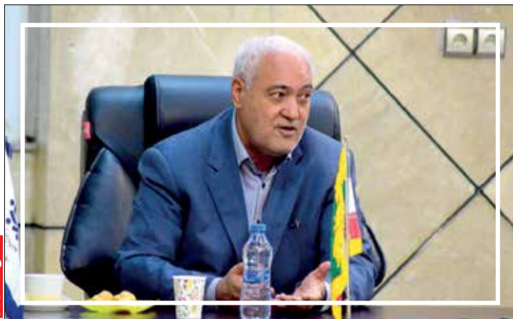
با هدف گذاری به اهداف رسیدم