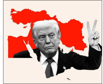
سید کامران یگانگی