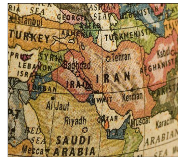
سیروس حاجی زاده

برای امنیت خود، شیوه‌های که باید به آنها رسیدگی شود و اولویت‌های امنیت منطقه‌ای متفاوت است.