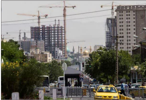
آیا این سبک معماری مشهد تناسبی با امام رضا دارد؟

وی در خصوص روند توسعه شهر مشهد به سمت غرب، گفت: ادامه پیدا کردن این روند باعث ایجاد یک مشهد جدید در غرب مشهد کنونی است. حتی قبل انقلاب استاندار وقت مراعات می کرد که در خیابان امام رضا، دید گلدسته حرم مسدود نشود. مروی با انتقاد از معماری حرم رضوی، بیان کرد: معماری مشهد باید تناسبی با موضوع زیارت داشته باشد. حتی جامعه‌شناسان و روانشناسان نیز اذعان دارند که مسیر زیارت باید به گونه‌ای باشد که زائر حس زیارت پیدا کند و وقتی وارد حرم شد آمادگی آن را پیدا کرده باشد. این نوسازی‌ها باید با معماری حرم تناسب داشته باشد. تولیت آستان قدس رضوی با بیان اینکه شورای فرهنگ عمومی باید به این مسائل پاسخ دهد که در مقابل این سیاست‌ها چه اقدامی داشته است، گفت: باید به این سوال پاسخ دهیم که چرا مشهد فقط به