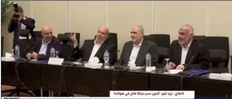
تاجیک - زید نوح - امین سر درخه فتح می‌هولندا

سفیر پیشین ایران در اردن می‌گوید: «حماس بعید است هیأتی که ترامپ برای اداره غزه پیشنهاد داده را بپذیرد؛ حماس تمایل دارد که مدیریت غزه توسط شخصیت‌های ملی فلسطینی انجام شود، و چندان علاقه‌ای ندارد سهم خود را در مدیریت اوضاع غزه پس از جنگ که اسرائیل آن را شخم زده، حفظ کند.»