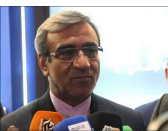
شده است. البته اساسنامه باشگاه هنوز به امضای نهایی نرسیده، اما روند کار با سرعت خوبی پیش می‌رود.

زیست‌محیطی است. این طرح، با تولید حداقل ۱۸ گیگاوات‌ساعت برق پاک در سال، علاوه بر کاهش وابستگی به منابع انرژی فسیلی، در بلندمدت نیز منجر به ایجاد درآمدهایی پایدار برای مدیریت شهری و شهرداری می‌شود. وی اظهار کرد: فراخوان عمومی شناسایی سرمایه‌گذار این پروژه در تیرماه سال جاری منتشر شد که پیشنهادات متعددی از متقاضیان دریافت شده است و در حال حاضر در مرحله بررسی فنی، مالی و حقوقی قرار دارند. مدیر توسعه خدمات و مدیریت دارایی‌های معاونت اقتصادی شهرداری مشهد گفت: آورده شهرداری در این پروژه که بر اساس مدل مشارکت طراحی شده، تا ۵۰ درصد از هزینه احداث نیروگاه را به صورت غیرنقدی (از طریق واگذاری املاک و مستغلات) است که پس از پایان فاز ساخت محاسبه و پرداخت خواهد شد. رئیس السادات افزود: در دوره بهره‌برداری پروژه نیز، شهرداری بر اساس توافق طرفین و آنالیز اقتصادی پروژه از درآمدهای ناخالص نیروگاه، سهم خواهد داشت. وی تصریح کرد: انتظار می‌رود با انتخاب نهایی سرمایه‌گذار و آغاز عملیات اجرایی، این پروژه تا پایان سال آینده به بهره‌برداری برسد.