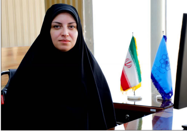
سرمایه‌گذاری مسئولانه و برنامه‌ریزی و در حال حاضر در مرحله بررسی فنی، مالی

در دستور کار خود قرار داد. مدیر توسعه خدمات و مدیریت دارایی‌های معاونت اقتصادی شهرداری مشهد ادامه داد: این پروژه که با هدف کاهش آلاینده‌های زیست‌محیطی، ارتقاء تاب‌آوری انرژی شهری تعریف شد، با آغاز فرآیند جذب سرمایه‌گذاران و جلب مشارکت بخش خصوصی به مرحله اجرایی نزدیک شده است. رئیس السادات تصریح کرد: پروژه نیروگاه خورشیدی مشهد نمادی از تلفیق