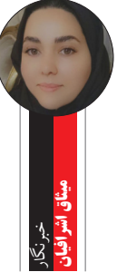
معاون وزیر آموزش و پرورش

معاون وزیر آموزش و پرورش با بیان اینکه آموزش و پرورش راهبر و راهنمای جامعه است و این باید مدنظر باشد، تصریح کرد: فلسفه این تغییرات برای همین اقتدار است، تودیع یک فرد به معنای ضعف و معارفه یک فرد نیز صرفاً به معنای قوت نیست، بلکه این تغییرات برای این است که جایگاه آموزش و پرورش یک گام رو به