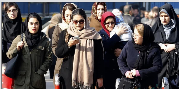
نباشد. مثلاً در قانون باید دست سارق را قطع کرد ولی تا کنون این مورد اتفاق نیفتاده است؛

چراکه وقتی شرایط آماده نباشد، اجرای قانون به تأخیر می افتد. سیاوشی اضافه کرد: زمان اجرای قانون حجاب به تأخیر افتاده ولی نمی توان آن را به صورت ترک فعل در نظر گرفت؛ در شورای امنیت ملی نیز به این نتیجه رسیدند که اجرای این قانون چند ماه به تأخیر بیفتد. اگر سران سه قوه با شورای امنیت ملی به نتیجه ای دیگر برسند، باز هم ترک