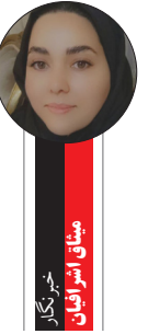
میانگین ترک تحصیل

مدیر کل آموزش و پرورش خراسان رضوی گفت: آمار ترک تحصیل دانش آموزان استان بالا است و شامل ۲۳ هزار نفر دانش آموز می شود.