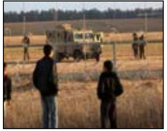
محمد علی مهتدی

خلیل الحیه نیز همین را تکرار کرد و گفت حماقت نتانیاهو و ممانعت وی از توافق برای حل بحران غزه ممکن است به قتل تعداد بیشتری از اسرا بیانجامد. این یعنی رژیم صهیونیستی از این پس هیچ امکانی برای آزادی اسرا ندارد. قتل اسرا و معادله جدید، تظاهرات گسترده ای را علیه باند حاکم در تل آویو برانگیخت. حدود ۳۰۰ هزار نفر تظاهرکننده سیاست نتانیاهو را محکوم کردند و خواستار انجام توافق برای آزادی اسرا شدند. این تظاهرات به درگیری با نیروی پلیس انجامید. پدیده دیگر موج استعفا فراماندهان نظامی و انتظامی بود که با استعفای فرامانده نیروی زمینی ارتش صهیونیستی بسیار چشمگیر شد. برخی منابع رسانه ای فاش کردند که فرامانده واحد جاسوسی ۸۲۰۰ که مقررماندهی اش در تل آویو مورد حمله موشکی حزب الله لبنان قرار گرفته است نیز در روزهای آینده استعفای خود را اعلام خواهد کرد. با این همه، به نظر نمی رسد که این تحولات تأثیری بر خط مشی نظامی نتانیاهو گذاشته باشد. وی در