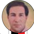
محمدرضا علی نژاد

عضو کمیسیون امنیت ملی و سیاست خارجی مجلس شورای اسلامی بر ضرورت توجه ویژه به پایتخت معنوی ایران در ردیف های بودجه ای تاکید کرد. حسن قشقای