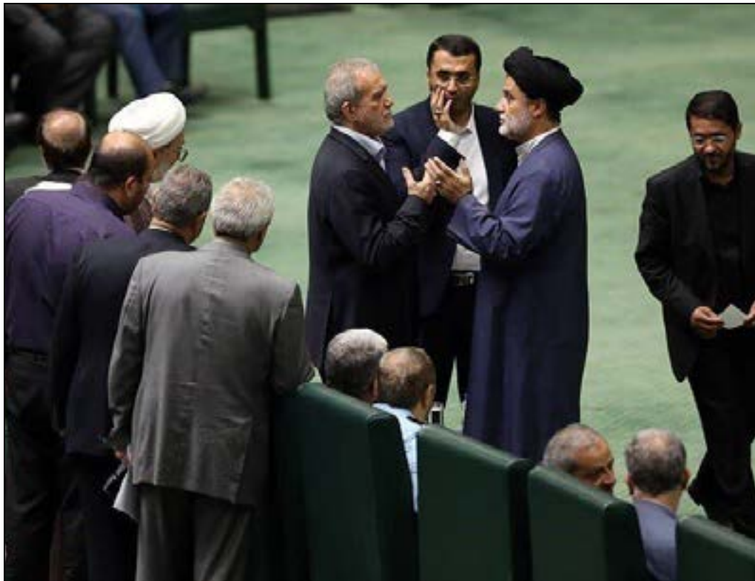
مجلس به برخی از وزرای پیشنهادی رأی ناپلئونی می دهد

نماینده مردم بابل در مجلس شورای اسلامی در مورد اینکه بنابراین ممکن است که نمایندگان رأی ناپلئونی به وزرای پیشنهادی بدهند، اظهار کرد: بله، مجلس به برخی از وزرای پیشنهادی رأی ناپلئونی می دهد. اما در مجموع این بحث مطرح است که اگر ۴۵ وزیری که نزدیک تفکر پزشکیان و اصلاح طلبان هستند و در واقع آرای پزشکیان را نمایندگی می کنند، از کابینه بیافتند و یا رأی ناپلئونی بگیرند، سوال این است که رویکرد دولت پزشکیان با چنین فضایی چگونه خواهد بود.