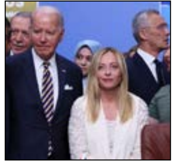
علی بمان اقبال زارچ

عضو ناتو در واشنگتن برای یک اجلاس هفتاد و پنجمین سالگرد ایجاد این ائتلاف در سال ۱۹۴۹ گرد هم آمدند. ایالات متحده قبول داده که از اوکراین و رئیس جمهوری آن ولودیمیر زلنسکی که به این کشور سفر کرده است، تشکر کند. البته زلنسکی قبل از رفتن به واشنگتن با سفر به ورشو در روز دوشنبه، یک پیمان امنیتی دوجانبه با لهستان امضا کرد. جولیان اسمیت، سفیر ایالات متحده در ناتو، هفته گذشته گفت: فکر می‌کنم اوکراین از آنچه روی میز گذاشته‌ایم راضی خواهد بود. همچنین جو بایدن، رئیس جمهور ایالات متحده، روز دوشنبه حملاتی را که دست کم ۲۶ کشته در اوکراین بر جا گذاشت، محکوم کرد و قبول داد «اقدامات جدیدی برای تقویت پدافند هوایی اوکراین» انجام دهد. وی که میزبان نشست ناتو در واشنگتن است افزوده است ما به همراه متحدان خود اقدامات جدیدی را برای تقویت دفاع هوایی اوکراین برای کمک به محافظت از شهرها و غیرنظامیان آن در برابر حملات روسیه اعلام خواهیم کرد. در همین حال رئیس جمهور ولودیمیر زلنسکی اعلام داشته که روسیه حملات گسترده‌ای را به شهرهای اوکراین آغاز کرده و این حملات بدترین حملات در بیش از دو سال تهاجم گسترده مسکو است. یانس استولتنبرگ، دبیر کل ناتو که اواخر دوران ریاست خود را سپری می‌کند گفت من از سران کشورها و دولت‌ها انتظار دارم که یک بسته تدابیر اساسی برای اوکراین اتخاذ کنند. او با برشمردن اقداماتی که انتظار