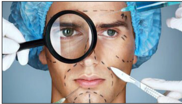
شبکه های اجتماعی چطور برای جراحی زیبایی مشتاقان می کند؟