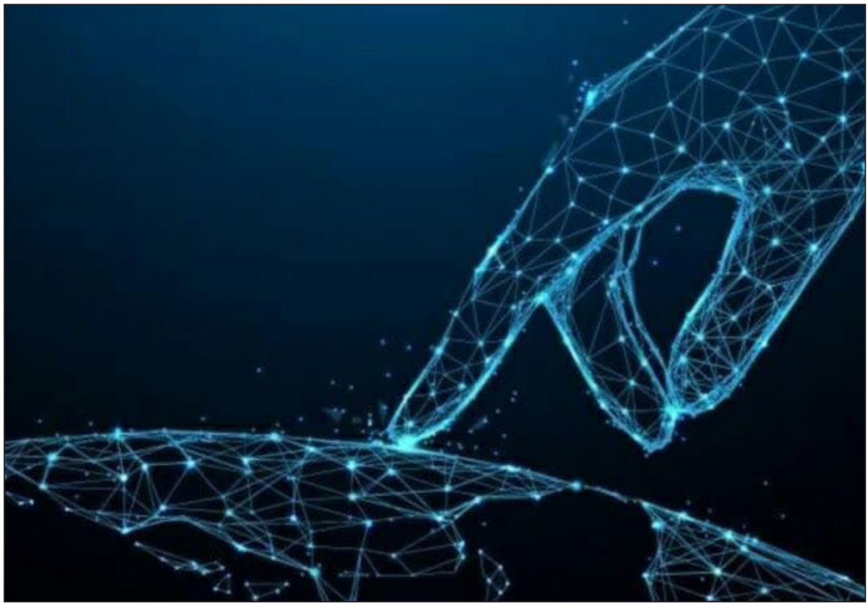
شگفتی‌هایی که برای تصمیم‌گیران دیپلماسی پدید می‌آید

حال چه نگرش بدبینانه آمریکا را بپذیریم و چه رویکرد خوشبینانه رژیم اسرائیل را باور کنیم، یک حقیقت قابل انکار نیست؛ عربستان سعودی وارد یک بازی رقابت جویانه جدی با قدرت‌های منطقه‌ای شده و خیزی بلند برای تبدیل شدن به قدرت برتر منطقه و رهبر بلانزاع جهان اسلام برداشته است. برخلاف سایر کشورهای منطقه که تنها به طراحی چشم انداز می‌پردازند و در تحقق آن مصمم و جدی نیستند، عربستان عملکرد بسیار مناسبی در اجرای کردن «چشم‌انداز ۲۰۳۰» خود داشته که با هدف تبدیل این کشور به موفق‌ترین کشور منطقه در کاهش وابستگی به نفت، تنوع بخشیدن به اقتصاد و توسعه بخش‌های خدماتی نظیر بهداشت، زیرساخت، آموزش، تفریح و گردشگری طراحی شده است. در چنین شرایطی تنها تهدید متوجه جمهوری اسلامی ایران توسعه پیمان ابراهیم و عادی سازی روابط عربستان و سایر کشورهای عربی و اسلامی با رژیم اسرائیل نیست؛ عربستان جدید موقعیت پرستیژی و راهبردی ایران را نیز مورد تهدید قرار داده است و چنانکه تمهیدات جدی برای هموردی و مهار آن اندیشیده نشود، کشورمان در آینده‌ای نه چندان دور جایگاه و اهمیت کلیدی و در نتیجه قدرت چانه زنی خود در منطقه را از دست خواهد داد و به بازیگری منفعل و تماشاگر تحولات تبدیل می‌شود.