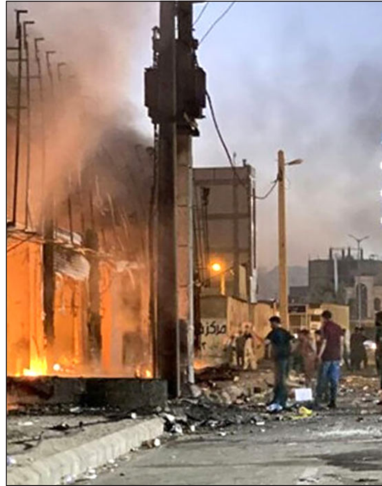
وقتی درهای کلانتری ۱۶ زاهدان شکست

جمعه اتفاقی که نباید بیفتد می‌افتد. درباره ماجرای تعرض به دختر چاهپاری دادگاه هنوز ادامه دارد و نتیجه آن اعلام نشده است ولی دو اتهام اول یعنی فراخواندن غیرقانونی و بازجویی در شرایط غیرقانونی ثابت شده است. درباره آزار و اذیت دادگاه هنوز حکمی صادر نکرده است. ولی فرمانده پلیس از نیروی انتظامی اخراج و اما با وثیقه خارج از زندان است. با یکی از خبرنگاران استان که حرف می‌زد می‌گفت مردم در نهایت نمی‌دانند بعد از این