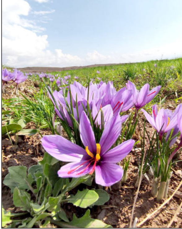
«اوسک» راهبردی موثر خروج زعفران از مظلومیت