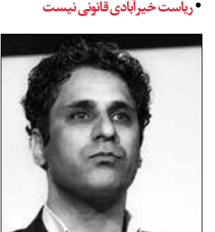
ریاست خیرآبادی قانونی نیست