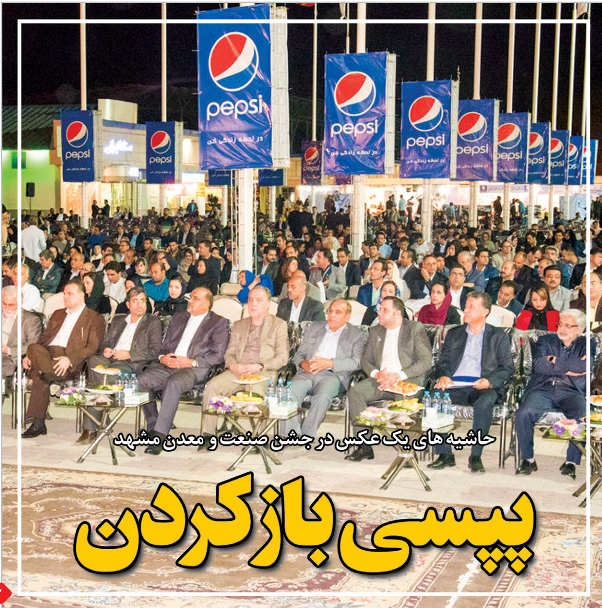
حاشیه های یک عکسی در جشن صنعت و معدن مشهد