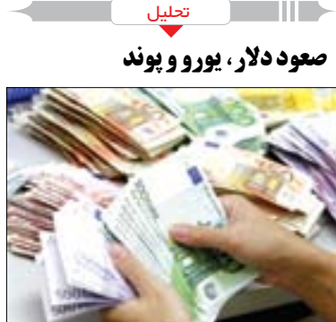
تحلیل صود دلار، یورو و پوند

بانک مرکزی نرخ تبادل ۲۹ ارز را برای روز چهارشنبه اعلام کرد که براساس آن نرخ ۳۰ درصد جله دلار، یورو و پوند نسبت به روز سه‌شنبه افزایش یافت. قیمت ۷ واحد پولی دیگر کاهش یافت؛ نرخ دو ارز نیز ثابت ماند. به گزارش اقتصاد آنلاین، براساس اعلام بانک مرکزی نرخ هر دلار آمریکا در روز چهارشنبه ۱۰٫۱۰ ریال افزایش نسبت به روز گذشته ۱۰٫۰۸۲ ریال و هر یورو با ۲۰۳ ریال افزایش ۲۲ هزار و ۴۶۶ ریال ارزشگذاری شد.