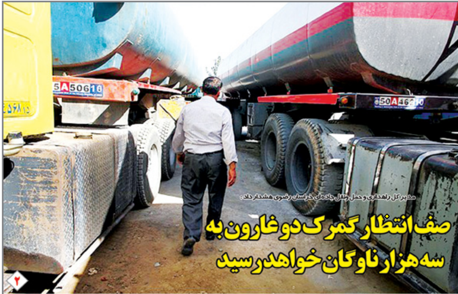
مدیرکل راهسازی و حمل و نقل خراسان رضوی هشدار داد: